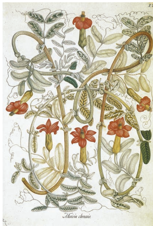
A l'esquerra, José Celestino Mutis, metge i naturalista de Cadis que va desplegar la seua labor científica en l'anomenat Nou Món, va organitzar l'expedició botànica a Nova Granada (actual Colòmbia). Alguns dels seus deixebles van adoptar posicions polítiques independentistes per les quals van acabar morint afusellats. A la dreta, l'expedició a Nova Granada va ser rica tant en resultats científics como artístics. Se'n conserven milers de làmines botàniques que representen les espècies arreplegades i descrites en el camp. Entre aquestes, la coneguda Mutisia, les rames de la qual conformen en aquest dibuix el monograma del nom del famós naturalista de Cadis.

de l'expedició francoespanyola a l'Equador, patrocinada el 1734 per determinar la figura de la Terra, es va decidir que hi figuraren botànics, com Joseph de Jussieu, entre els objectius del qual hi havia estudiar la matèria mèdica americana. Els arbres de la quina van ser trobats i descrits pels expedicionaris francesos.