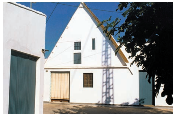
Barraca de Simonet el de Català. Partida de Savoia, Alboraià. És una de les zones més habitades del terme d'Alboraià.