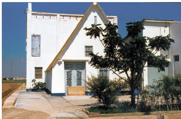
Barraca del Roto. Partida del Miracle, Alboraià. A vora barranc del Carraixet, és una mitja barraca que no està habitada tot l'any.

És així com la ciutat de València, al nord, ja ha arruïnat pràcticament la totalitat de barraques, excepte les que, residualment, pugua haver-hi al Marítim o al Cabanyal, formant part d'una altra construcció. Al sud de la ciutat, a la Punta, hi ha nombroses barraques, però l'espai de l'horta sembla acabar-se més ràpid que al nord. Si no ara, aviat. El trasllat del parc central, les obres de la ZAL, la ronda sud de València completaran