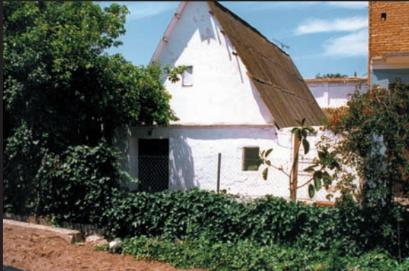
Barraca de ca Belloch. Marítim-Vera de València. Està ubicada entre les universitats de València, la Politècnica, la N-221, el metre i un carrer de València.