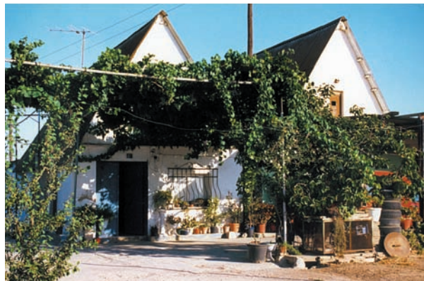
Barraques del Güere. Partida de Calvet, Alboraia. Ben conservades, encara que una hipotètica revisió del PGOU les podria soterrar.

Una altra opció cara al futur seria deixar-les estar en peu, però la dinàmica dels últims anys ha demostrat que aquesta última opció és pràcticament inviable. Una altra solució, la que proposava la primera Iniciativa Legislativa Popular de la història del País Valencià defensava el turisme agrari i compensar els llauradors per viure a la terra entenent l'agricultura com un fet cultural. Però la ILP ha estat tombada, i els llaura-