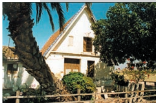
Barraca del Coix de Navarro. Ubicada a la partida del Miracle d'Alboraia, duu abandonada bastants anys.

Barraca de la partida de Vera de València. Ubicada pràcticament al costat de l'ermita de Vera, el sostre ha caigut i només hi ha runes.