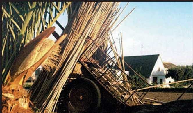
Barraca nova o barraca de Donís. Partida de Meliana d'Almàssera. La proximitat al nucli urbà fa que una futura ordenació territorial la pugui desplaçar. Està previst que pels seus voltants vaja l'avinguda dels Drets Humans d'Almàssera, que l'enderrocaria.