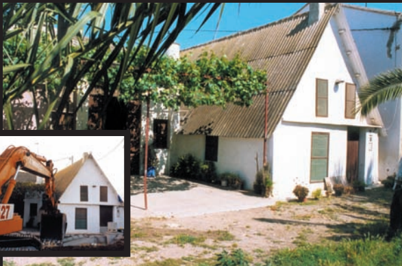
Barraca de Sento el Tou en una imatge de novembre del 2001. Les obres d'ampliació del polígon industrial d'Alboraià aviat posaran fi a la barraca.