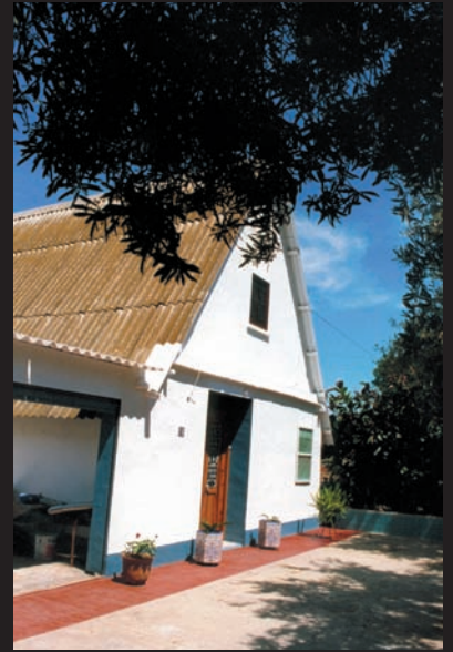
Barraca de ca Olmos. Partida del Marítim de València. La ciutat avança. Aquesta imatge està presa a finals del 1999. Avui els terrenys que fiten amb la barraca ja són només un solar.