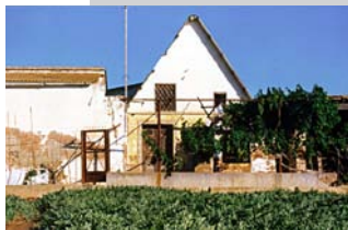
Barraca de les Neles. Partida de la Mar d'Alboraia. En millor conservació que la d'Almàssera.