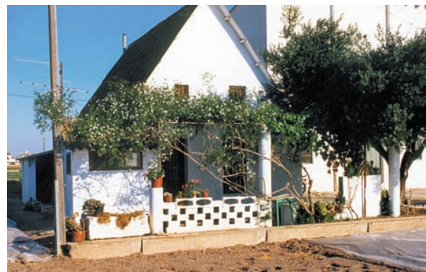
Barraca de Rata. Partida de Savoia, Alboraià. La zona del camí del Gaiato ofereix racons encisadors.