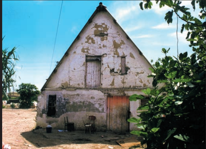
Barraca abandonada. Partida del Marítim de València. Igual com les de les partides de Vera, està rodejada d'edificis.