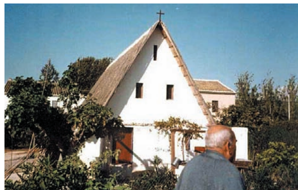
Barraca municipal d'Alboraià. Partida del Miracle, Alboraià. Va ser alçada el 1999 per llauradors com a homenatge a les moltes barraques que hi havia al terme no fa massa anys.