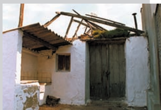
Barraca de Messeguer. Partida de la Mar d'Almàssera. Està en runes.

Barraca de la partida de Vera de València. Ubicada pràcticament al costat de l'ermita de Vera, el sostre ha caigut i només hi ha runes.