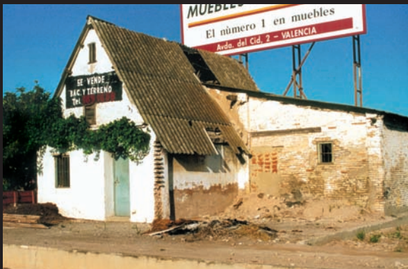
Barraca de cal Carro. Camí Farinós de Benimaclet. L'abandonament també és causa de ruïna per a les barraques. Aquesta està ubicada prop de la N-221 i el cementeri de Benimaclet i poc caure en qualsevol moment.