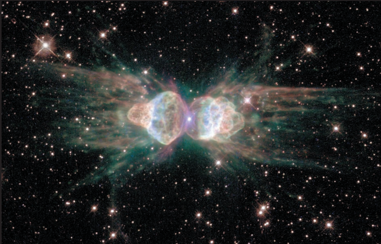
La nebulosa planetària de la Formiga. L'any 1997, els astrònoms B. Balick i V. Icke utilitzaren el telescopi espacial Hubble per obtenir una imatge d'aquesta nebulosa. R. Sahai i J. Trauger obtingueren una altra imatge amb diferents filtres un any després. La imatge reproduïda és una composició de les dues.

L'energia generada en el nucli per aquestes reaccions produeix pressió cap a l'exterior que compensa la tendència a col·lapsar de les capes més externes, deguda a la força gravitatòria. Mentre es manté l'equilibri entre aquestes forces l'estel roman estable. En anar esgotant-se el combustible –la quantitat d'hidrogen– no es pot produir suficient pressió per compensar la gravetat, aleshores l'interior de l'estel comença a contraure's. La temperatura i la densitat al nucli augmenten considerablement i això permet reactivar les reaccions termonuclears per transformar ara heli en carboni. Aquest procés produeix una gran quantitat d'energia que fa augmentar la lluminositat de l'estel; al mateix temps, però, l'estel s'infla –el diàmetre augmenta unes 200 vegades– i com a conseqüència d'aquesta expansió la temperatura minva: l'estel es va convertint gradualment en un gegant roig. Aquesta evolució és molt més ràpida com més massiu és l'estel. Finalment també s'esgota l'heli, i el nucli, format per carboni i oxigen amb una massa d'aproximadament el 60% de la massa