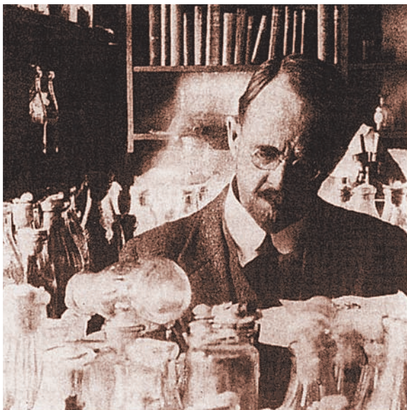
Els principals protagonistes del descobriment del DNS. Dalt, Thomas H. Morgan treballant al seu laboratori. A la dreta, Rosalind Franklin, junt amb Francis Crick, Maurice Wilkins i James Watson.

També Charles Darwin va tenir els seus antecessors oblidats; ni tan sols el gran Jean-Baptiste Lamarck (1744-1829) és prou recordat, i això que va ser el primer que va sostenir la transmissió hereditària dels caràcters adquirits (lamarckisme). Però en aquesta galeria de científics oblidats és necessari recordar Alfred Russell Wallace (1823-1913), qui, al costat de Rosalind Franklin, representa el victimisme de dues de les grans icones científiques, el darwinisme per a Wallace i el DNA per a Franklin. Wallace, incansable viatger, va concebre, independentment de Darwin, el principi de la selecció natural i quasi al mateix temps que aquest va presentar les seues observacions en la