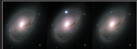
Les tres imatges de la galàxia M96, a 40 milions d'anys llum, es van fer amb el telescopi d'1.2 m de l'observatori Whipple, el 14-3-97 (esquerra), on no s'aprecia la supernova; el 18-5-98 (centre), on assoleix la màxima brillantor; i el 19-11-98 (dreta), on ja és evident que la lluminositat ha minvat.

La raó d'aquesta acceleració no és clara. Els cosmòlegs parlen, sense saber ben bé què és, d'energia fosca: no és matèria i per tant no es pot detectar per cap efecte gravitatori, tampoc no emet radiació. Es tracta d'una energia que s'associa al mateix espai buit, que actua com una gravetat repulsiva amb pressió negativa i que pot ser la responsable de l'acceleració còsmica... curiosament, això és el que fa la constant cosmològica. Molts s'han afanyat a replegar-la de la paperera d'Einstein i, encara que no siga l'única forma d'energia fosca –hi ha altres alternatives amb noms tan suggeridors com quintaessència–, la constant cosmològica produeix l'acceleració en l'expansió còsmica que les supernoves llunyanes han mostrat.