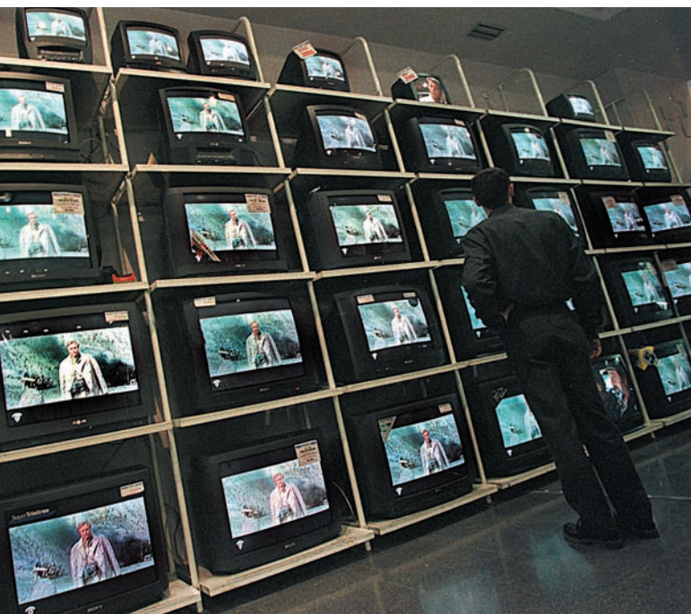
De l’activitat científica, n’apareix una visió deformada i empobrida al cinema, la televisió o els còmics; es presenta les persones que treballen en ciència com algú genial, home, blanc, que treballa individualment, o encara pitjor, com a antiherois perversos, bojos, o instruments del poder.

Però no són necessàries tantes manifestacions d’adults. Els mateixos estudiants, segons diverses investigacions, assenyalen com els principals causants de la seua actitud desfavorable, del seu desinterès cap a la ciència i el seu aprenentatge, la presència en l’ensenyament d’una ciència descontextualitzada de la societat i de l’entorn, poc útil i sense temes d’actualitat, junt amb altres factors, com el mètode d’ensenyament del professor, que qualifiquen d’avorrit i poc participatiu, l’escassetat de pràctiques i, especialment, la falta de confiança en l’èxit quan són avaluats. Però aquestes dificultats es trobaven compensades fa pocs anys per un major prestigi i majors possibilitats de col·locació, aspectes que, actualment, no són tan clars per als estudiants, d’ací la importància de la imatge pública de la ciència i la tecnologia.