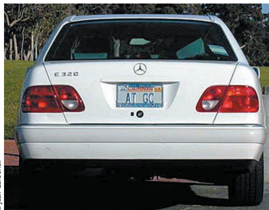
Fotografia de la matrícula del coche de Francis Crick. Fixeu-vos en les lletres i el seu ordre!

Francis Crick ens va proporcionar un punt de vista més "reposat" sobre la gènesi del model de la doble hèlix i sobre les investigacions immediates a què va donar lloc (Crick, 1990). El 1950, l'interès dels químicofísics se centrava a desvelar l'estructura de les proteïnes, ja que, en general, es creia que constituïen les molècules bàsiques per a la transmissió de la informació genètica. Entre els laboratoris