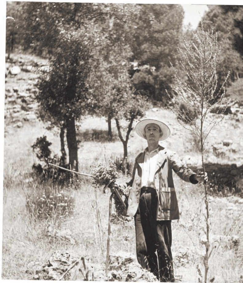
El guia de l'expedició junt amb un notable exemplar de Verbascum hervieri (Serra de Cazorla, 1948).

De vesprada ens vam passar una hora discutint el preu de lloguer d'unes quantes mules (ja que el nostre cotxe no era adequat per al transport per la muntanya), però el matí següent, l'1 de juliol de 1947, els animals ens estaven esperant, ja carregats de grans barres de pa. La nostra ruta ens va dur a través de La Iruela, el castell de la qual és un dels més espectaculars d'Espanya, cap al Gilillo (1.847 m), en els vessants del qual vam veure per primera vegada la Viola cazorensis en les roques calcàries. Aquest petit arbust amb tiges esveltes de color rosa, cobert amb fulles semblants al ginebre, de les axil·les de les quals sorgeixen llargues tiges, produeix flors simples d'un rosa puríssim i és, per a mi, i encara avui, després de tota una vida d'estudiar la botànica en diverses parts del món, una de les plantes més belles del món. Es diu que quan Gandoger va trobar aquesta espècie per primera vegada, es va llevar el barret i va fer una reverència, tot dient: " Madame, je t'adore! ". Evidentment, un home de bon gust. Al seu torn, l'abat Hervier, en el seu comentari sobre la Viola cazorensis en el catàleg sobre les plantes recollides per