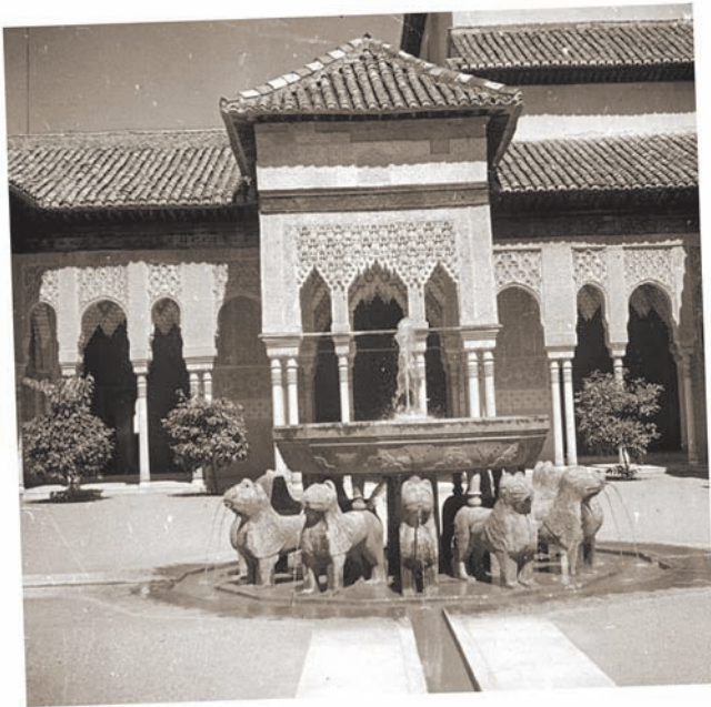
Patio de los Leones, Alhambra, Granada 1948. No resulta difícil imaginar la impressió que el fabulós palau de l'Alhambra i els jardins del Generalife, amb els pics coberts de neu de Sierra Nevada en la distància van causar en aquell estudiant de vint anys.

Salto de los Órganos, dominat pels seus cims com uns tubs d'orgue. Forma un arbust menut amb rosetes terminals de fulles platejades en forma d'espàtula i grans capítols de vistoses flors blanques en abundància. Mentre els nostres guies feien la migdiada a l'ombra, jo em vaig dirigir cap al fons del barranc a ple sol i allà, des del llit del riu, sota els torrents d'aigua que queien en cascada, veia les fulles platejades i el rizoma negre temptadorament fora de l'abast en les parets de roca calcària. En aquella època en el camp es calçava botes d'escalada adequades, amb claus d'alpinista, i no botes de sola de goma o sabatilles, i així, ajudat per una vella branca i ascendint amb dificultat per les roques, vaig aconseguir fer caure uns quants capítols amb fruit dels quals vam extraure llavors que més tard es van cultivar en el Reial Jardí Botànic d'Edimburg i van créixer en el cèlebre jardí de roques.