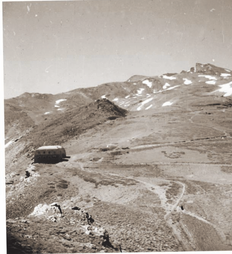
Sierra Nevada, amb la seua rica flora, ens va cridar i vam emprendre el viatge amb cotxe muntanya amunt per la carretera tortuosa, la més alta d'Europa, fins a l'alberg en Los Peñones de San Francisco, just per davall del pic de la Veleta (3.398 m).

De Granada ens vam dirigir al sud, a la costa subtropical de Motril i vam travessar Almeria, fins arribar a Múrcia, on vam pujar la serra de Carrascoy i hi vam trobar Thymus murcicus , pertanyent a la secció Pseudothymbra d'aquest gènere que era molt semblant a la T. membranaceus i estretament emparentat amb T. longiflorus (timó de flor llarga) que vam veure a Sierra Nevada. Més tard vam topiar amb el rar T. funkii fora de Sant Miquel de Salines. Aleshores el nostre viatge ens va dur a Xàtiva, on vam ascendir els vessants del castell buscant Lapiedra martinezii , i a València, on vaig conèixer l'orxata. El nostre viatge a Espanya va acabar a Catalunya, on vam arribar a Igualada i ens vam afegir al pelegrinatge cap als cims punxeguts de Montserrat i vam agafar el funicular més amunt del monestir fins al cim, on, en la dura roca basàltica, eren freqüents la Saxifraga catalaunica i l' Erodium supracanum i, més enllà dels boscos de boix, les flors rugoses del Ramonda myconi . Un agradable viatge d'un dia en cotxe ens va dur a la frontera de la Jonquera. La