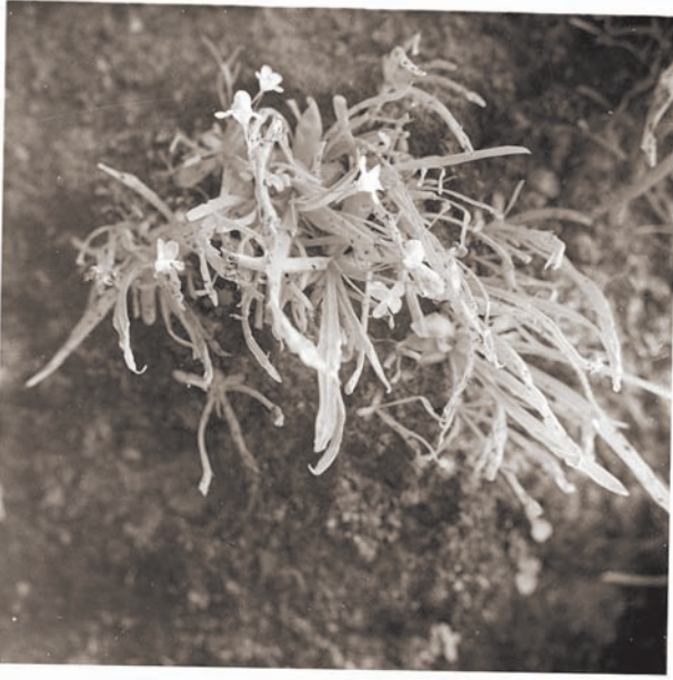
Pinguicula vallisnerifolia , Cueva de la Magdalena, 1948. Seguits per una processó de tafaners vam pujar els vessants rocallosos sobre el poble cap a la cova de la Magdalena, en els sostres i les parets de tosca de la qual sabíem que creixia la rara Pinguicula vallisnerifolia .

bar el camí de tornada a Montenegro, on tot el poble estava esperant per a veure'ns.