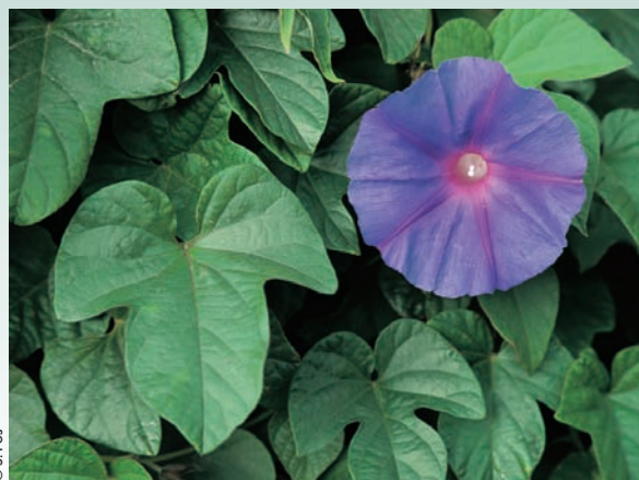
Algunes antigues plantes útils han esdevingut espècies invasores, cas de la mata de la seda ( Araujia sericifera ), a l'esquerra, i de la campanera blava ( Ipomoea indica ), a la dreta, freqüents als tarongerars abandonats.