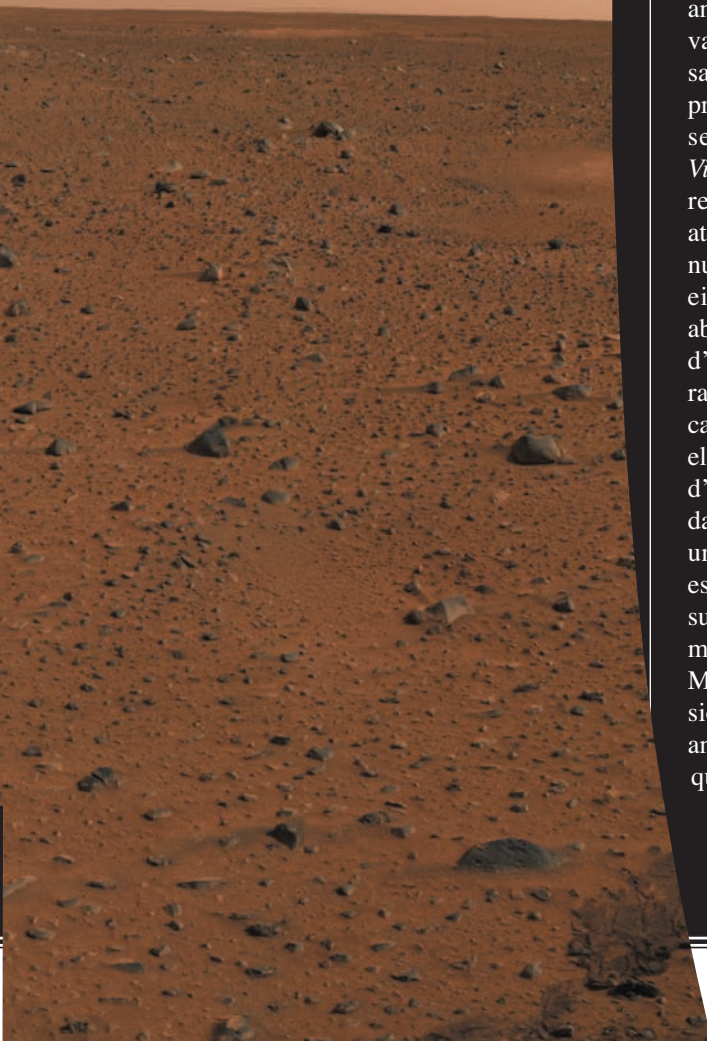
Primera imatge en color del rover Spirit , obtinguda per la seua càmera panoràmica. S'hi pot veure el típic paisatge marcià d'arena taronja esguitada per roques, sota un cel rosa.

jançant la mesura de neutrons solars que reboten de la superfície) grans quantitats d'hidrogen (possiblement aigua en forma de gel), a pocs metres de profunditat.