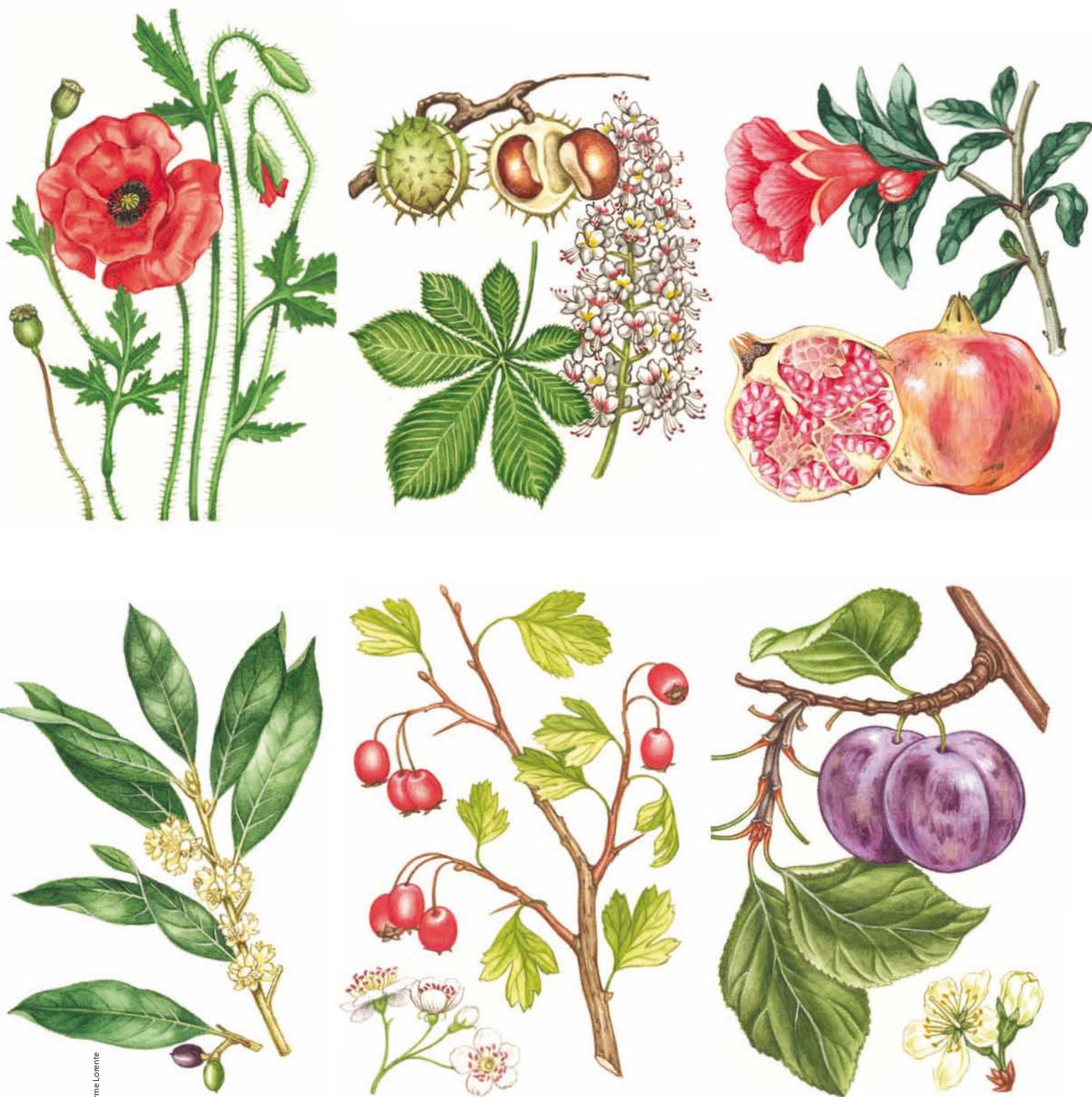
Figura 1. Els efectes de l'escalfament global es poden detectar a casa nostra a partir de canvis fenològics (Peñuelas i altres, 2002) en la planta. Hi ha exemples de floració avançada a la columna de l'esquerra: a dalt, Papaver roheas (rosella) i a baix, Laurus nobilis (llorer). A la columna del mig, exemples de sortida de fulla avançada: a dalt, Aesculus hippocastaneum (castany d'índia) i baix Crataegus monogynia (espinalb). A la columna de la dreta, exemples de fructificació avançada: a dalt, Punica granatum (magraner) i a baix, Prunus domestica (prunera).