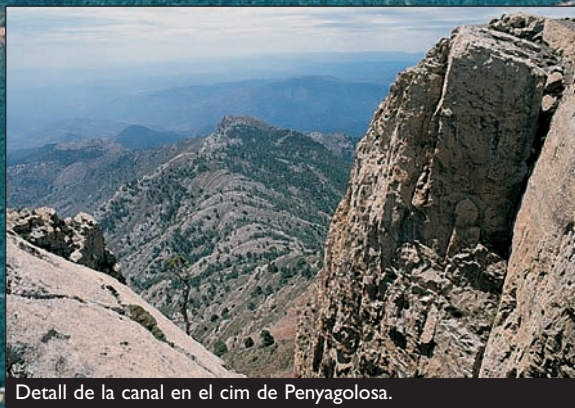
Detall de la canal en el cim de Penyagolosa.