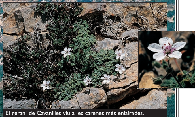
El gerani de Cavanilles viu a les carenes més enlairades.