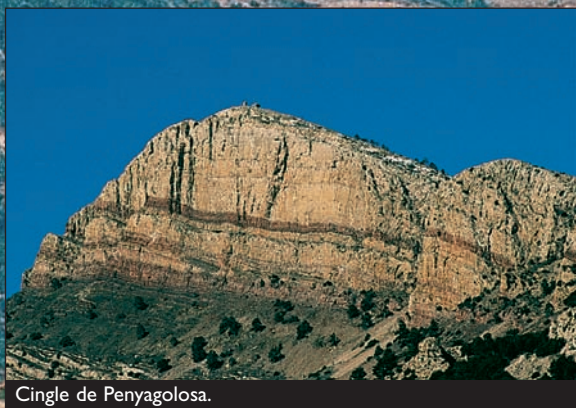
Cingle de Penyagolosa.