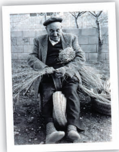
Fent llata d'espart a Biar (Col·lecció Museu Arqueològic Municipal d'Alcoi Camil Visedo).