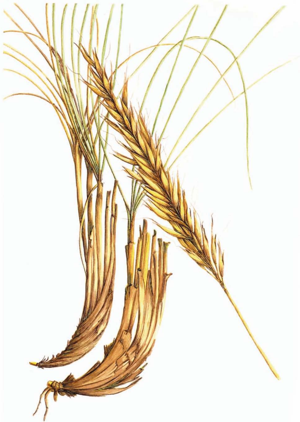
Stipa tenacissima L.