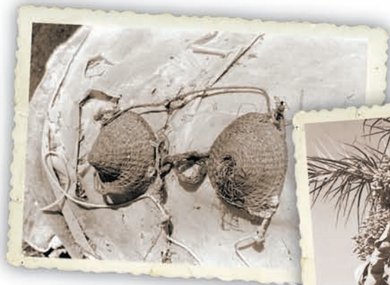
Dalt, ulleres de batre a la Torre de les Maçanes (Col·lecció Museu de Prehistòria i de les Cultures de València). A la dreta, collint els dàtils a Elx, primeria dels anys vuitanta (Col·lecció Museu de Prehistòria i de les Cultures de València). D'espart són bona part dels estris amb què els podadors i collidors puguen delicadament a la palmera.