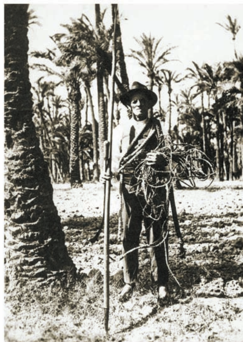
Palmerer d'Elx amb estris d'espart, cap a 1940.

En època islàmica continua l'elaboració de cordam exportat pel port d'Alacant i s'hi afegeix la fabricació