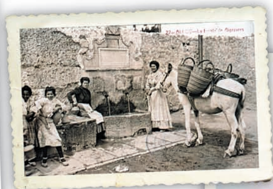
Dalt, sàries d'espart i cistelles de vímet a la font dels Algepsars d'Alcoi a l'inici del segle xx (Col·lecció Museu Arqueològic Municipal d'Alcoi Camil Visedo). A la dreta, cadira de boga i cadira d'espart a Olocou (Col·lecció Museu de Prehistòria i de les Cultures de València).