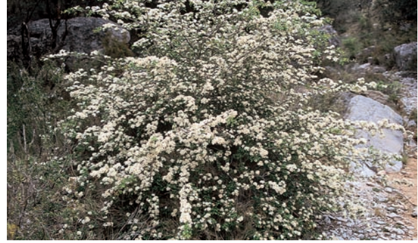
Floració de Crataegus monogyna al llit del barranc.

nitats de les dues sèries de vegetació climatòfiles presents: sèrie mesosupramediterrània valencianotarragonina basòfila de la carrasca ( Hedera helicis – Querceto rotundifoliae sigmetum ) i sèrie supramesomediterrània catalanoaragonesa i del Maestrat basòfila del reboll ( Viola willkommii – Querceto fagineae sigmetum ), distintives de les condicions ambientals i de les modificacions causades pels usos ancestrals del territori.