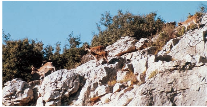
Cabra salvatge als vessants rocallosos del barranc.

trufa ( Tuber melanosporum ), molt apreciada com a condiment per l'aroma i sabor.