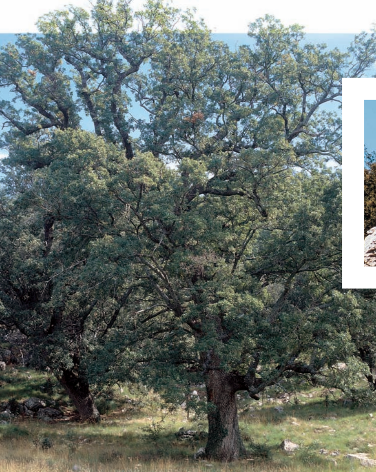
Roure de fulla petita centenari al pla de les Barraques, antiga zona carbonera de la finca i devesa del ramat.