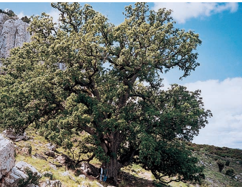
El roure gros, un esplèndid exemplar de 20 metres d'altura i 6 metres de perímetre de tronc, amb una edat estimada de 550 a 600 anys.

dels mètodes de silvicultura tradicional i de les mesures de protecció establertes des de l'Edat Mitjana. Es practiquen llavors tals massives fins al cessament d'aquesta activitat al llarg del segle XIX, de tal manera que avui la superfície de les rouredes és simbòlica respecte als seus primitius dominis.