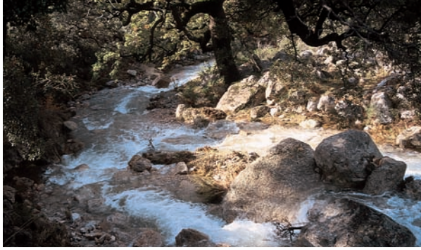
Llit del barranc dels Horts amb fort cabal en un període excepcional de pluges, l'any 2000.