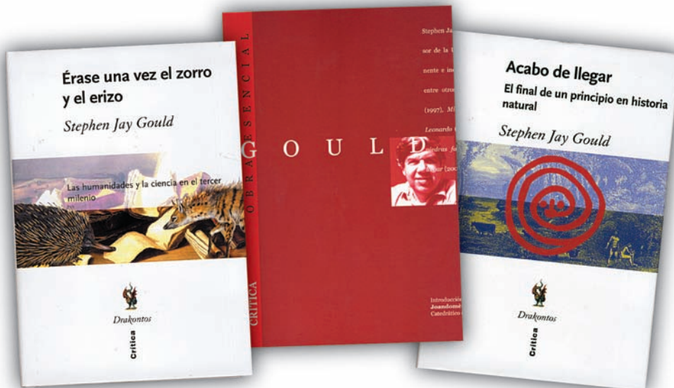
Gould és un divulgador magistral perquè transmet un missatge científic senzill i efectiu, ple d'implícacions i ressonàncies. En la fotografia, darreres obres divulgatives de Gould en versió espanyola.