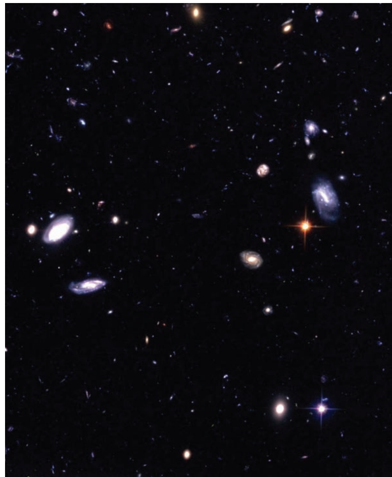
Fragment de la imatge de l'Ultra Deep Field, presa pel telescopi espacial Hubble i publicada el 2004. S'hi observen centenars de galàxies a les distàncies més llunyanes mai observades.

Observatori Astronòmic de la Universitat de València