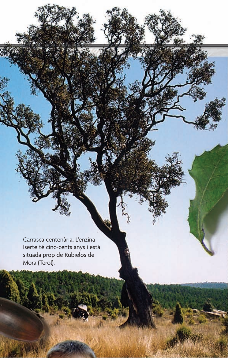
Carrasca centenària. L'enzina Iserte té cinc-cents anys i està situada prop de Rubielos de Mora (Terol).