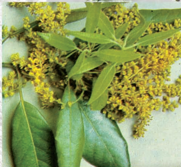
Dalt, inflorescències masculines de l'alzina. Són aments, penjats, amb moltes flors individuals sense pètals que formen un ramell.

Arbre de creixement pausat però amb molta vitalitat, pot rebrotar vigorosament després dels incendis o sequeres gràcies a les seues poderoses arrels.