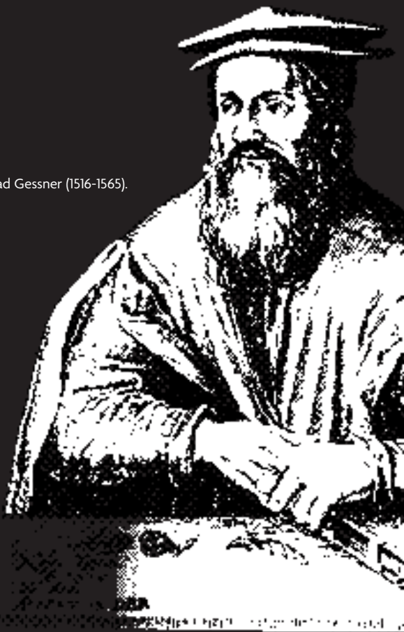
Konrad Gessner (1516-1565).

No obstant aquesta dedicació erudita, pròpia de l'interès per compendiar un coneixement que en el seu temps creixia espectacularment impulsat per l'expansió