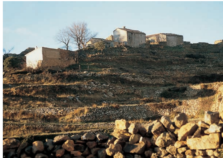
Mas de Costa, Lluçena (Alcalatén).