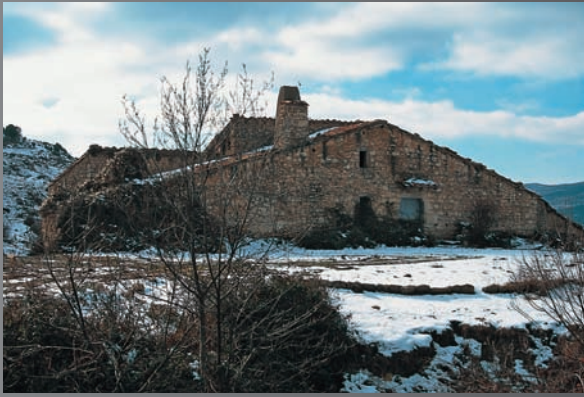
Mas del Racó, Forcall (Ports).

«A LES NITS HIVERNALS, LES LLARGUES VETLADES VORA EL FOC NO DEIXAVEN OCIOSA LA FAMÍLIA, OCUPADA EN UNA INFINITAT DE TASQUES DE MANTENIMENT, RELEGADES PER A QUAN EL MAL TEMPS FORÇAVA A RECLOURE'S EN L'HABITATGE.»