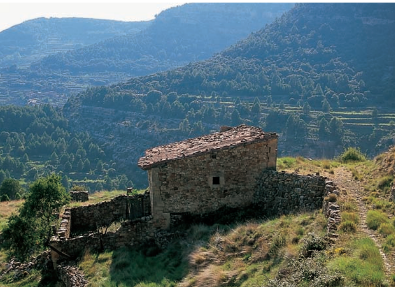
Mas Nou, Vistabella (Alcalatén).