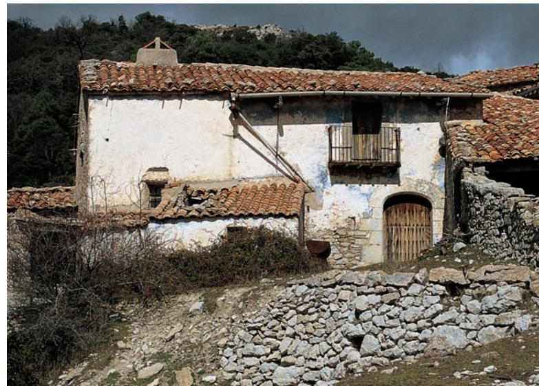
Mas d'en Segures, la Tinença de Benifassà (Baix Maestrà).