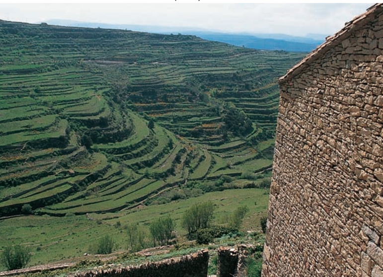
Mas de Castellfort (Ports).

ha llegat un expressiu paisatge material del treball agrícola en què sorgeix l'habitatge unifamiliar aïllat i indissociable de l'explotació, la masia o el mas, segons l'àrea lingüística en què s'ubique. La proliferació de masies i població dispersa com a model de vida i economia comprèn una cronologia d'auge d'uns 200 anys, que definitivament tanca el seu cicle en el segle XX.