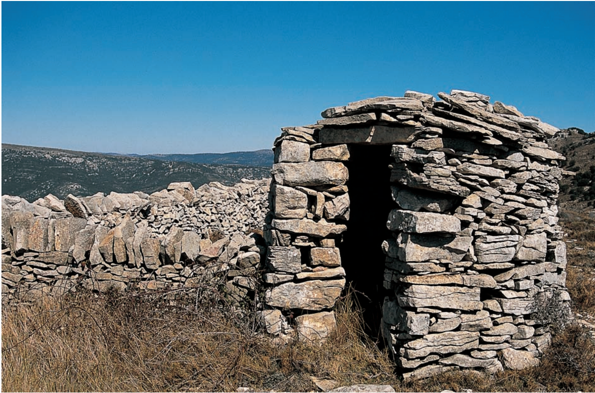
Abric de pastor de pedra seca (Castelló).

tat agrícola i la notable dualitat de les terres valencianes, una cridanera dicotomia que simplifiquem amb l'esquema litoral/interior, regadiu/secà. Hem transmès la imatge deformada i incompleta d'un país de terres feraces i càlides poblades de llauradors feliços, un clixé exportable i veraç per a les terres litorals, però que no identifica la pluralitat d'una geografia difícil, on l'home s'ha instal·lat com ha pogut, modelant un mosaic de paisatges a la seua mesura que, en la seua diversitat i imaginativa resposta davant un medi no sempre generós, conforma la singularitat històrica i cultural d'aquest país mediterrani.