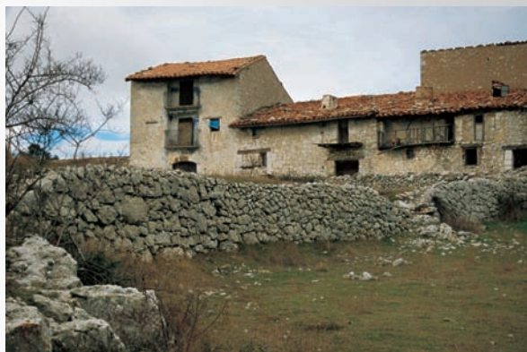
El Mas Blanc (a dalt i foto de doble pàgina), a la Tinença de Benifassà (Baix Maestrat). El Mas Blanc va ser quartell general de Cabrera en la primera guerra carlista.