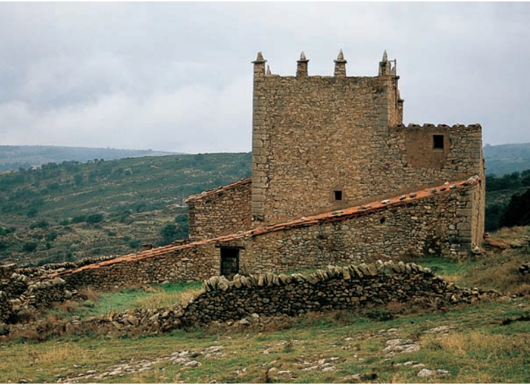
Mas fortificat, Culla (Alt Maestrat).