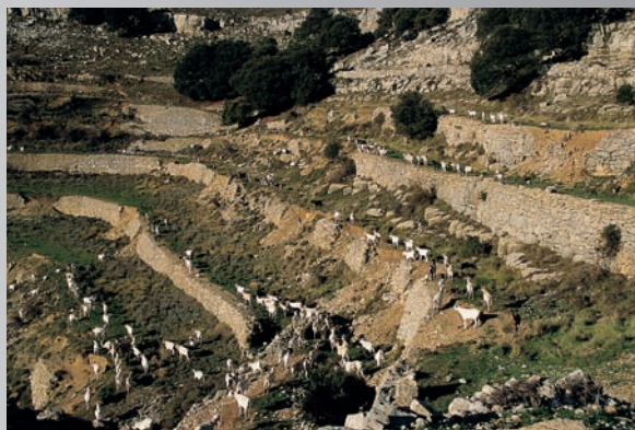
Serra de la Nevera, Catí (Alt Maestrat).