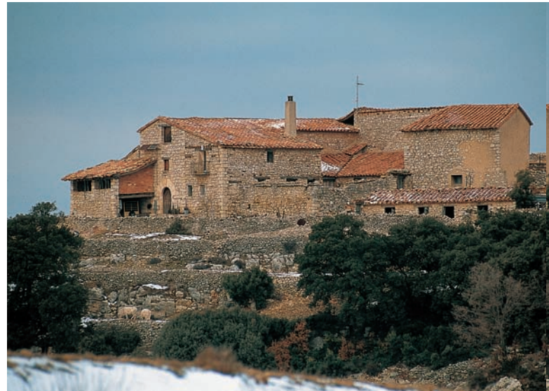
Mas de la Mola Garumba, Forcall (Ports).

En l'extensa i encrespada orla muntanyosa que guarneix l'interior valencià, les inertes restes materials del treball i la vida a les masies configuren un paisatge social i cultural d'un ahir pròxim: la darrera generació de masovers encara conserva alguns dels seus protagonistes, homes i dones que van viure la infància i part de la seua joventut en els anys finals de les masies. Un paisatge despulat de vida i dipositari en el seu abandó dels trets d'identitat i història dels llauradors valencians en la lluita per l'existència. La magnitud i extensió dels seus vestigis revela expressivament la dispari-