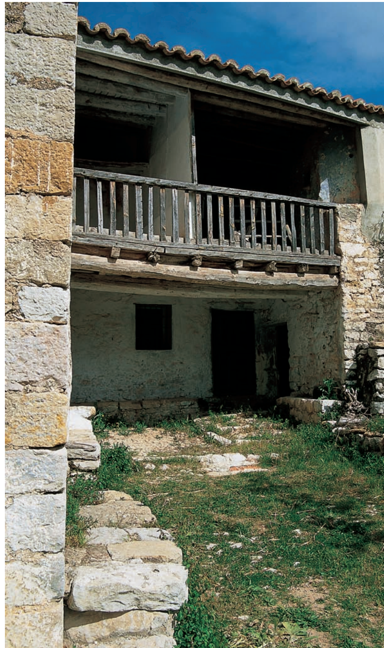
Mas els Talàs, Vallibona (Ports).

L'habitatge articula en el seu entorn una sèrie de dependències i construccions auxiliars (corrals, quadres, eres, abeuradors, graners, pous, assagadors), elements alçats en gran part amb la tècnica de la pedra seca, la sàvia arquitectura de mínims, el material de la qual és la pedra sense argamassa de compactació, que es prodiga com un càstig a la muntanya mediterrània. En la multiplicitat de tasques del dia a dia i en els períodes estacionals que regien els ritmes vitals de la masia, tot obeeix a un fi i tot s'interrelaciona en una