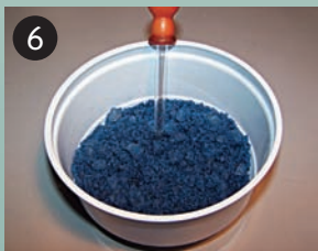
Seqüència de la pràctica.

Així quedarà el teu pot de sals de bany aromàtiques.