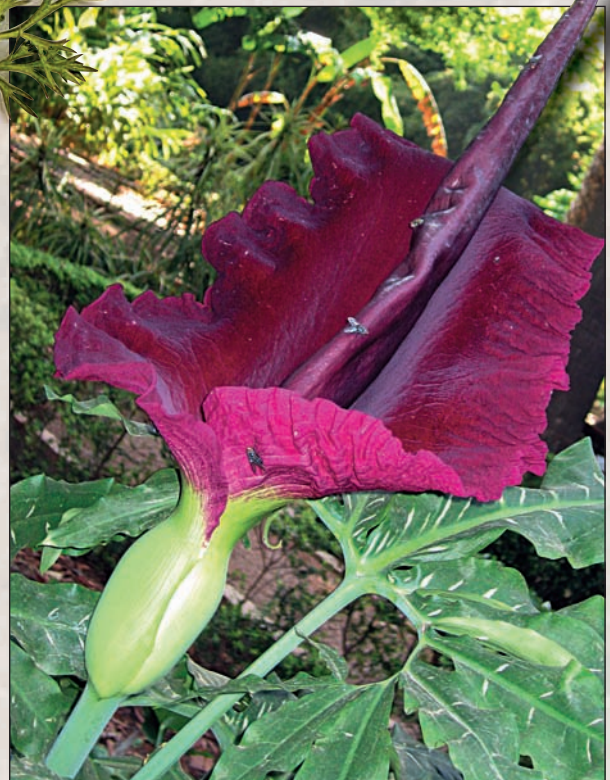
Dragonera ( Dracunculus vulgaris Scott).