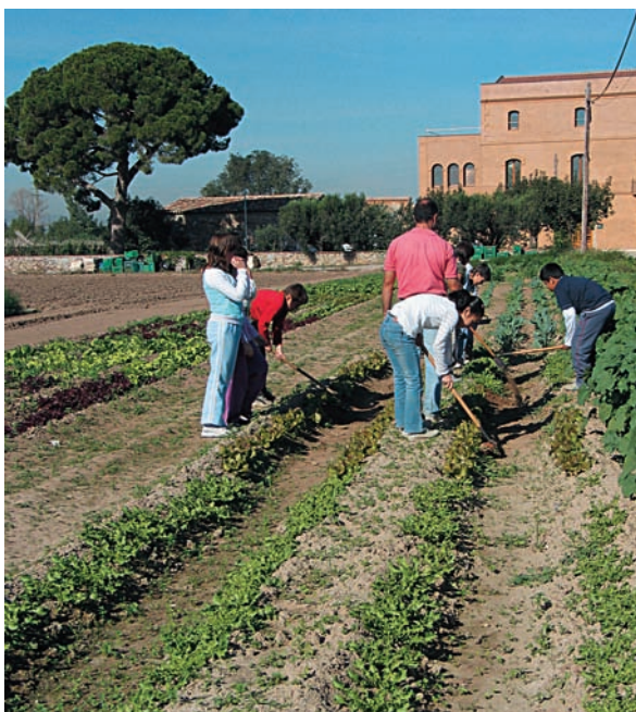
A la masia de Can Comas, el Parc Agrari organitza circuits pedagògics.