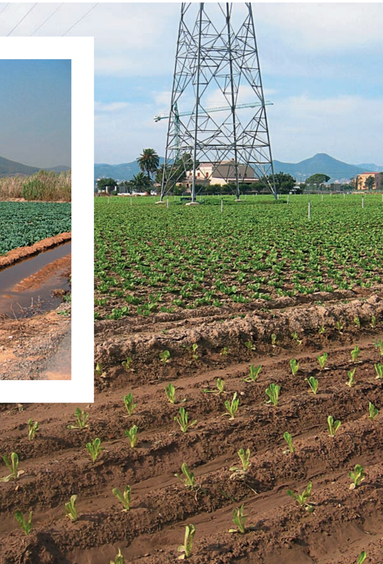
Les terres agrícoles estan sotmeses a la pressió d'infraestructures de tot tipus.

esquarterat, maltractat, sovint menyspreat per tothom. El delta del Llobregat, amb 90 km quadrats de superfície i 23 km de front litoral, no és una excepció, tot i haver estat durant molt de temps el rebost de Barcelona. De fet, fins i tot se'l coneixia com la terra de les cinc collites, segons la pagesia de la zona, una terra tan fèrtil com el mateix delta del Nil.