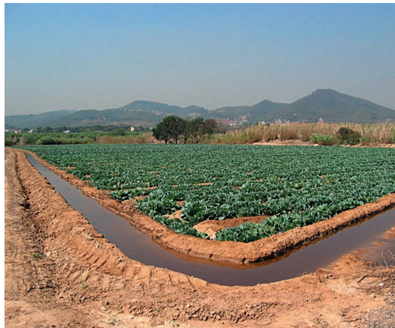
El Parc Agrari està integrat per catorze municipis del delta i la vall baixa del Llobregat (esquerra). A dalt, al delta del Llobregat encara subsisteix un sistema de rec antic que caldria conservar.