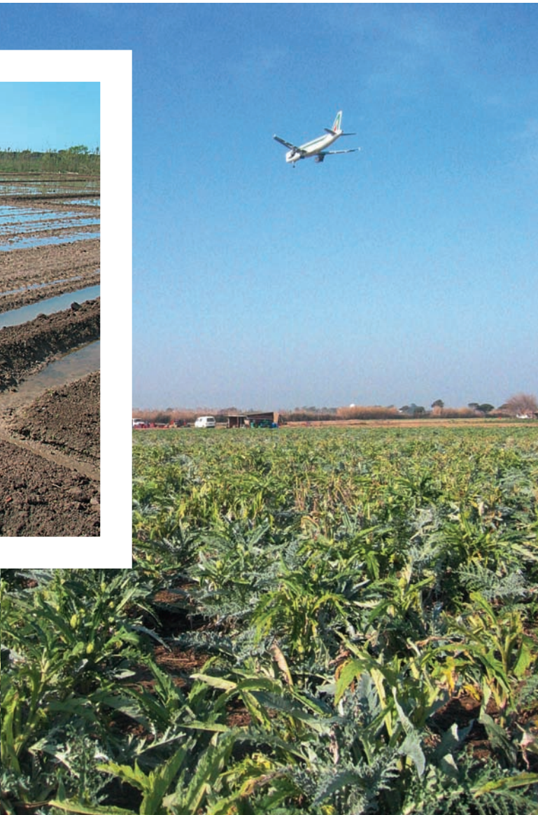
Els camps de carxofes i l'aeroport del Prat són dos elements distintius del delta.

(alguns pagesos, cada vegada menys, tenen parada), i es destina una part de la collita de carxofes a la indústria conservera de Múrcia. Les cooperatives tenen cada vegada menys incidència, sobretot a causa de la presència tan propera d'un gran mercat potencial com el de Barcelona, que provoca que la pagesia prefereixi vendre individualment la seva producció. De totes maneres, la globalització econòmica, que permet l'arribada de productes d'arreu del món a preus més ajustats i amb costos de producció molt menors, i l'enfortiment de zones de producció d'hortalisses com són els camps de Múrcia i Almeria, fan que les terres deltaïques hagin per-