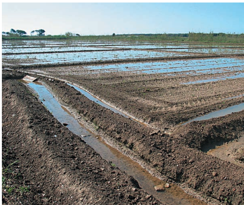
La pràctica d'estanyar els camps es realitza des de temps immemorials al delta per enriquir els sòls.

nats de fruites i hortalisses s'aturin. Si bé el Parc Agrari en un principi va ser vist amb molt de recel per la major part de la pagesia local, fins i tot els sectors més antagonics han hagut d'admetre que s'han dut a terme actuacions encertades que dignifiquen aquest ofici en un espai tan fràgil i compromès.