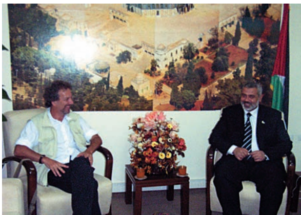
Aquesta foto de l'entrevista que mantingué Scott Atran amb el primer ministre palestí, Ismail Haniyeh, va ser presa tan sols una estona abans que l'estança fos bombardejada i semidestruïda per l'exèrcit israelià.