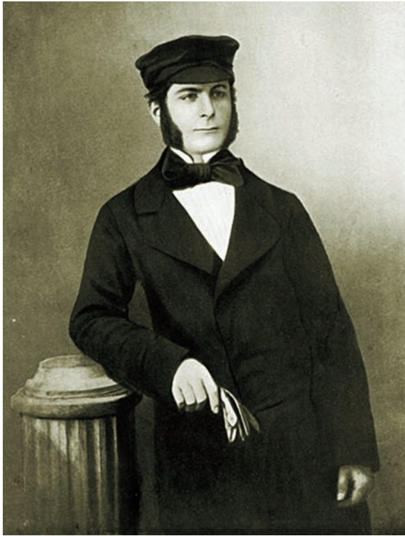
Galton quan encara no havia fet la trentena, poc abans de partir cap a Sud-àfrica.

jo, com un lleial membre del grup, hagués fugit vers la plana per un sender que per fortuna hagués vist, seguit pels grunys aprovadors del meu savi i respectat cap. I ara sento, de tornada de la meva àrdua expedició, amb tanta informació, que el suposat perill era un error, car no hi havia senyal de hienes al veïnat. Se'm fa entendre per primer cop que el crit del meu cap no feia referència a cap hiena a la plana, sinó a un lleopard entre les branques dels arbres; la seva gola havia estat un xic desafinada: això era tot. Bé, els meus treballs no han estat en va; ja és alguna cosa haver demostrat que no hi ha hienes a la plana, i em veig en una bona posició per arribar a ser vigilant de lleopards entre les branques dels arbres. Mentrestant, Vive Pangenesis .