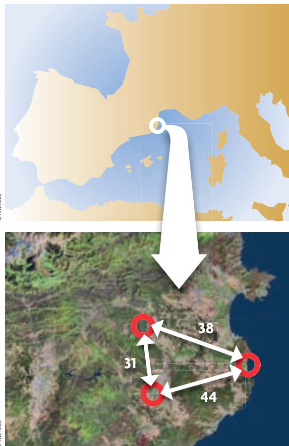
Mapa de l'àrea estudiada al nord-est peninsular, a la demarcació de Girona, amb els tres nuclis de llacunes de nova creació i la distància que els separa, en quilòmetres. Se situen dins una mateixa regió però en canvi estan afectats per factors locals diferents. L'estabilitat hidrològica –assecatge, règim hídic– ha demostrat ser el factor que més condiona aquestes llacunes.

I una prova d'això és que, seguint en el mateix estudi, la majoria de paràmetres de la comunitat –descriptors que expliquen com s'organitza: la riquesa d'espècies, la diversitat taxonòmica, la diversitat filogenètica o l'abundància d'individus– no varen variar significativament al llarg del primer any. En una comunitat que es trobés en un procés de successió –des d'una situació inicial deserta o amb uns pocs organismes pioners; avançant cap a estadis intermedis de la successió, més rics en espècies; i amb el rumb posat a l'estadi final, climàtic, on haurien de vèncer els més ben adaptats a l'ambient ja estable– serien esperables canvis en aquests descriptors. Per tant, la comunitat s'estructuraria o, el que és el mateix, aniria avançant –no sempre gradualment ni a una mateixa velocitat– seguint una sèrie d'estadis descrits i normalment ordenats: la successió . En canvi, el que s'observà en aquest estudi és que tan sols un paràmetre –la biomassa– d'entre els set analitzats presentava variacions significatives al llarg del primer any. La biomassa tendia a créixer al llarg del primer any, però