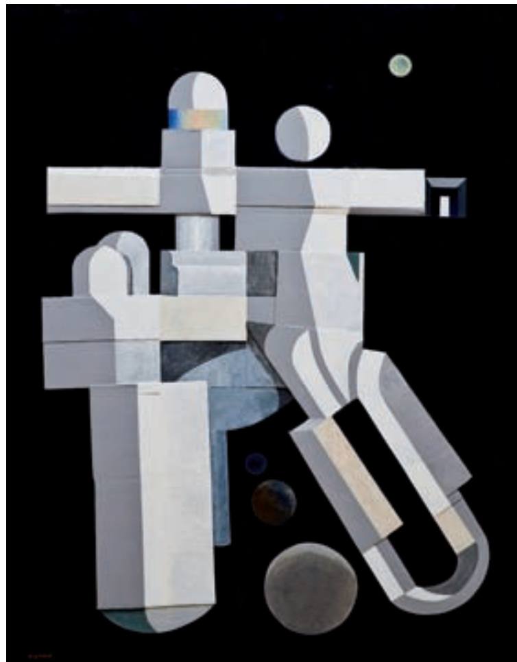
Nassio Bayarri. Creació espacial d'Adam i Eva , 2009. Acrílic i cartró sobre taula, 195 x 225 cm.

pregnades de constructivisme, resulten colpidores per l'ús del color i de la forma: atresoren una energia impel·lent, i duen títols com ara Arribada extraterrestre , Nau guerrera , Formació racionalista del cosmos , El servidor alienígena , Cap alienígena formàtic ... Un artista pot construir tota la seua obra sobre una intuïció, i en la seua capacitat de resistir els embats del proïsme (la gara-gara que produeix la seua obra) rau sovint la seua