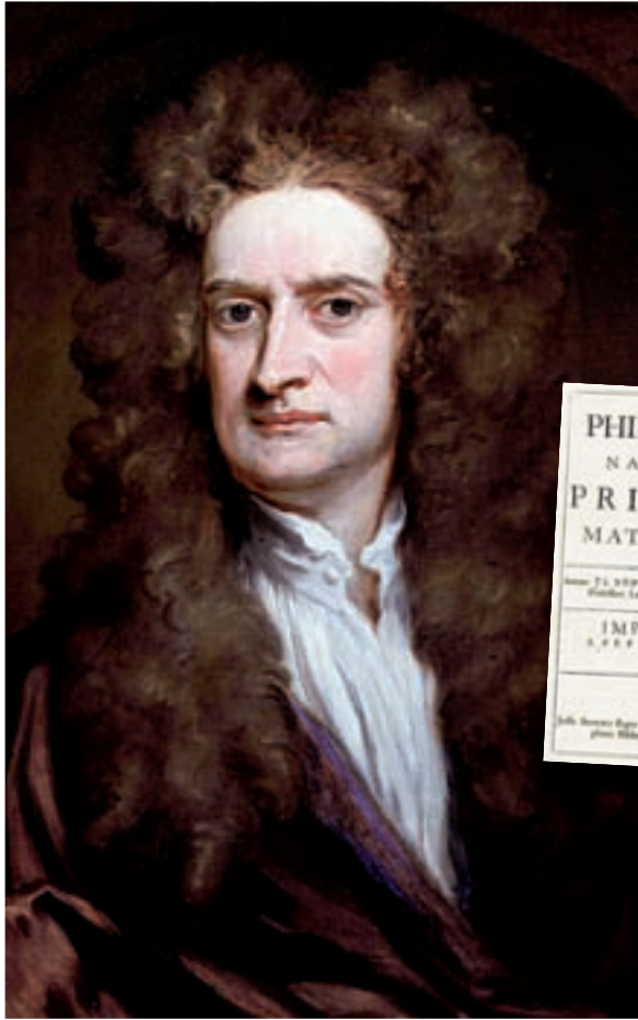
Sir Godfrey Kneller. Sir Isaac Newton , 1702 (detall). Oli sobre llenç, 62,2 x 75,6 cm. A la dreta, portada de la primera edició dels Philosophiæ Naturalis Principia Mathematica de Newton, on el físic desenvolupa la llei de gravitació.