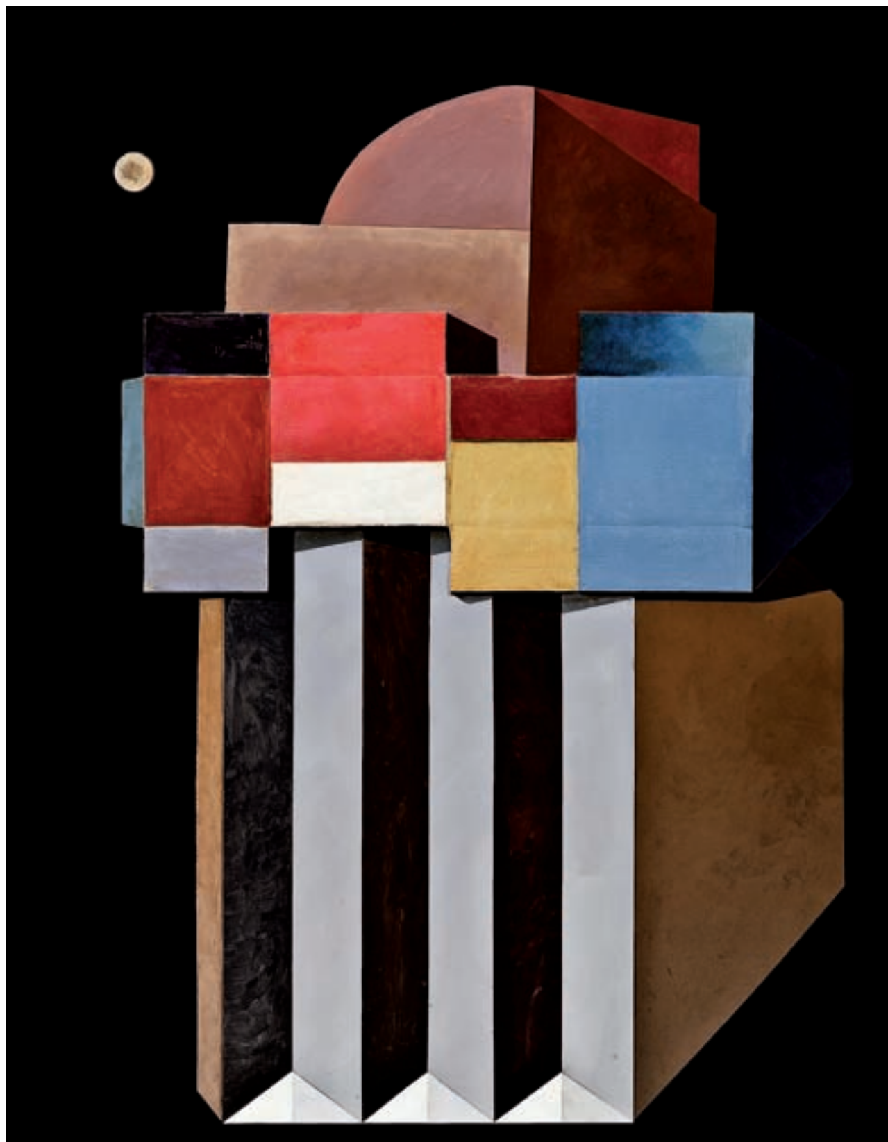
Nassio Bayarri. La casa del pare còsmic , 2009. Acrílic i cartró sobre taula, 195 x 225 cm.