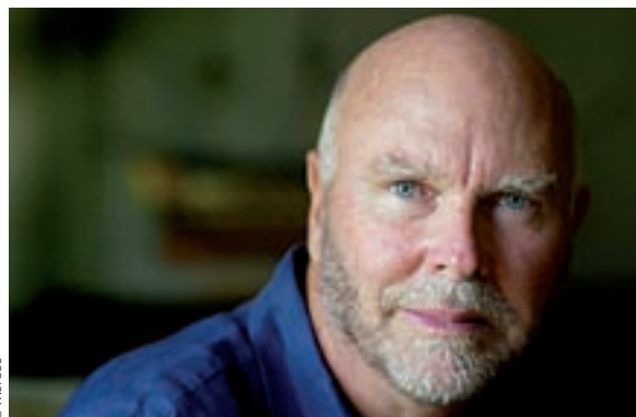
Craig Venter, president de l'institut que porta el seu nom i responsable del grup de recerca que va crear, a finals de 2007, el primer cromosoma artificial.

Què més cal fer? No sols cal fabricar un genoma, suposant que coneixem la llista de gens, sinó que hem de saber en quin ordre cal disposar-los, quines seqüències reguladores ha de contenir, com interaccionaran totes les seues proteïnes, quin metabolisme és el que sostindrà la vida cel·lular mínima, etc. Si l'objectiu és una cèl·lula natural minimitzada, ja podem dir que hem fet grans passos. Però si l'objectiu és la síntesi química d'una cèl·lula, encara ens falta un bon tros.