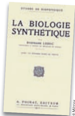
Portada del llibre d'Stéphane Leduc La biologie synthétique , imprès a París el 1912 i potser la primera obra científica en què es va emprar aquest terme.

S'esperaria, segons la concepció de l'enginyeria, que les parts biològiques (siguen proteïnes, factors de transcripció, seqüències promotores o altres elements) tingueren un comportament totalment fiable i previsible en qualsevol context, que foren totalment intercanviables, la qual cosa és més que dubtosa sota la concepció sistèmica. Per exemple, potser una proteïna actua d'una determinada manera en un context en què l'hem caracteritzada i, per contra, manifesta altres propietats o funcions en un context diferent. Podem preveure o controlar totes les seues possibles manifestacions o evitar que la seua funció franquege uns marges