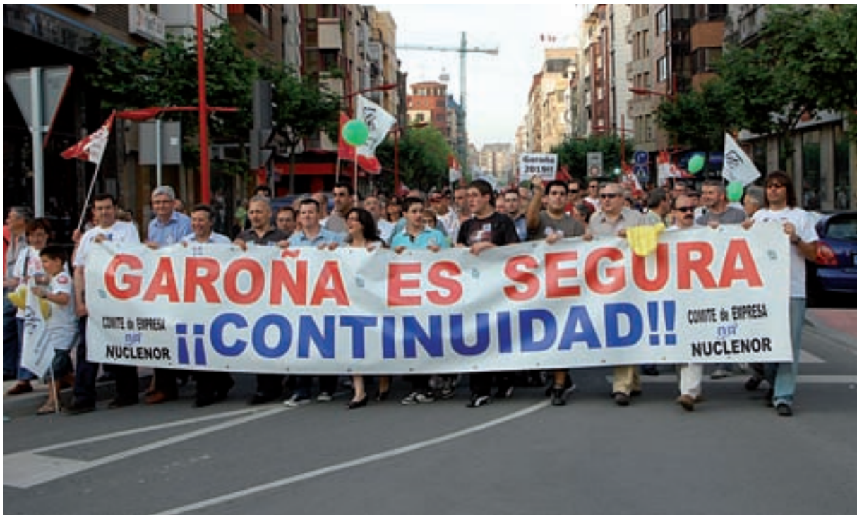
Les raons per instal·lar o no centrals nuclears en un país són econòmiques i polítiques. Inevitablement hi conflueixen arguments i interessos confrontats. A la dreta, manifestació de Greenpeace a les portes de la central nuclear de Vandellòs. A l'esquerra, una protesta per la decisió del Govern de tancar la central nuclear de Garoña.

per refredar-lo i perquè en desapareguen els isòtops de semivides més curtes. El gran problema, que al nostre parer encara no s'ha resolt satisfactòriament, és què fer amb els residus radioactius. La majoria de països dipositen en llocs especials els de baixa i mitjana activitat generats en centrals, hospitals i indústries. S'introdueixen en contenidors apropiats, que són emmagatzemats en centres situats en superfície o a poca profunditat. El Cabril, a Còrdova, rep les 2.000 tones anuals de residus generats a Espanya, amb semivides inferiors a trenta anys. Però les centrals espanyoles també produeixen unes 160 tones anuals de residus d'alta activitat, i cal un temps d'uns milers d'anys per tal que la seua radioactivitat baixi al nivell del mineral inicial. S'han de garantir les condicions de seguretat adients durant tot aquest temps.