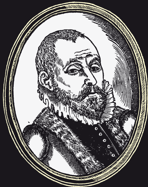
Làmines del Tractado de las drogas de Cristóbal Acosta fruit de les seues herboritzacions en la costa Malabar i altres llocs de l'Índia.

La seua obra botànica pertany al corrent renaixentista, que va donar gran impuls a les herboritzacions regionals i a la flora exòtica, en la línia que representen Leonhard Fuchs i Otto Brunfels. El principal interès botànic d'Acosta era l'aplicació terapèutica de les plantes, i seguia el mètode de descripció botànica de Valerius Cordus consistent