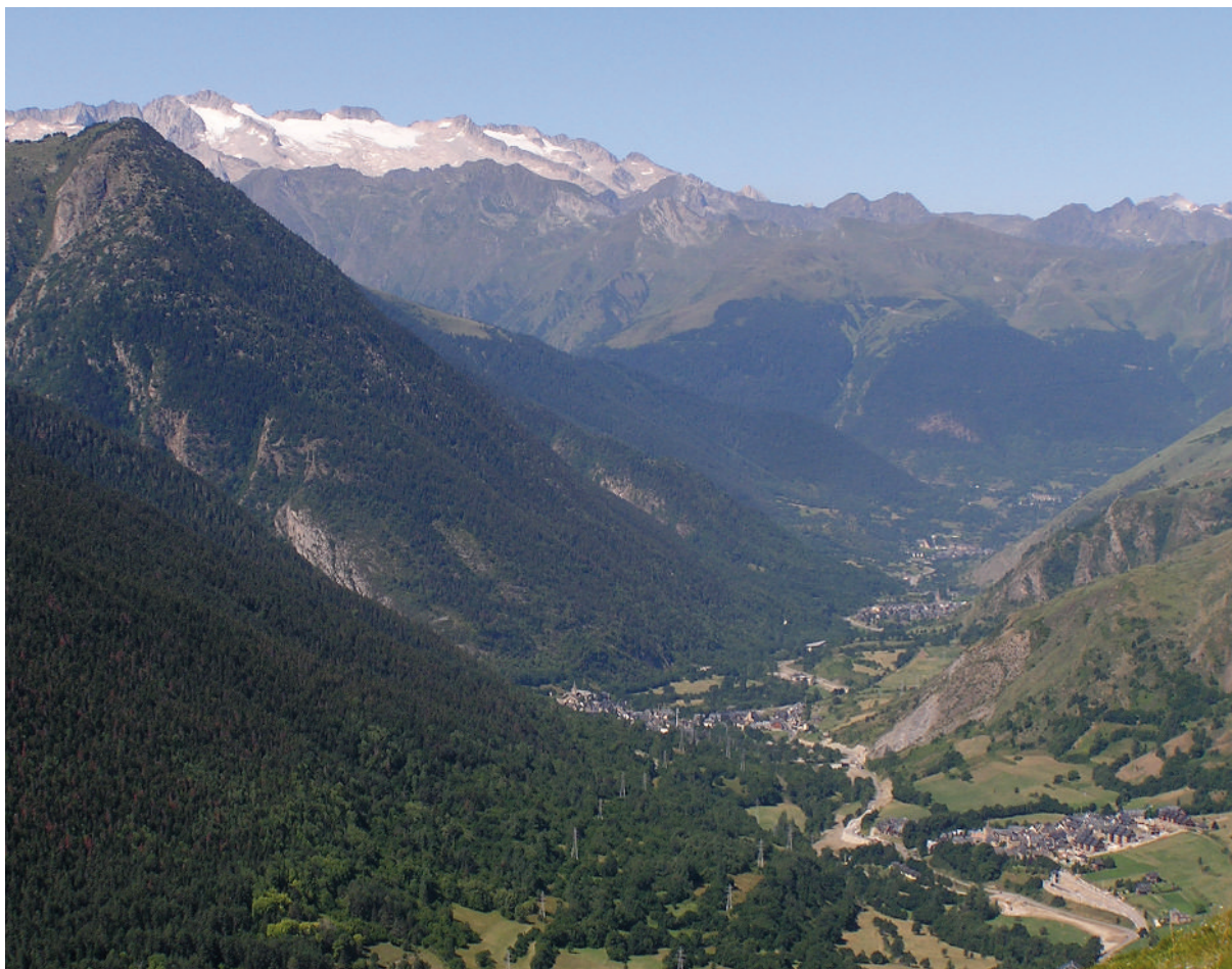
Paisatge de la Vall d'Aran (Alt Pirineu i Aran).