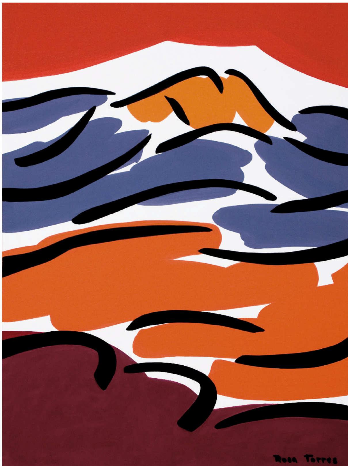
Rosa Torres. Montseny , 2008. Acrílic sobre cartró, 35 x 46,5 cm.