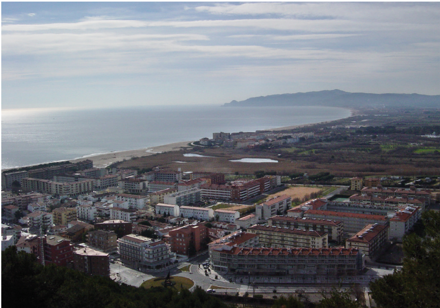
Paisatge de la plana del Baix Ter (Comarques Gironines).

complexes com els imaginaris futurs o les propostes per al paisatge. L'experiència va resultar molt satisfactòria des del punt de vista tècnic, però també ho va ser per als participants.