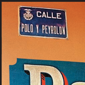
Entre senyals de circulació, semàfors, mig amagats entre el "mobiliari urbà" apareixen aquests rètols dels nostres naturalistes oblidats.