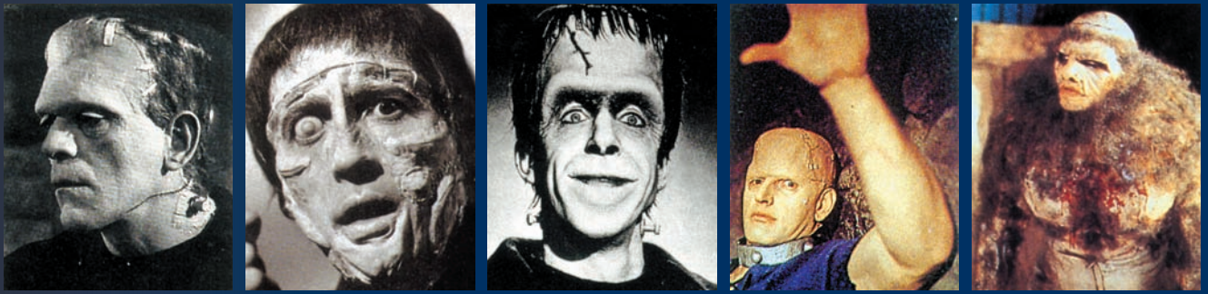
Com Rousseau, Frankenstein es va tirar a si mateix i a la seua empresa perquè va ser incapaç de reconèixer en la seua criatura la humanitat que pretenia salvar i en nom de la qual havia iniciat la seua creació

relacions encara més monstruoses, si això és possible, entre aquella empresa aberrant de crear un nou ésser perfecte i la política del seu temps, i del nostre. Sobre la il·lustració, la civilització, la barbàrie o la revolució. Sobre el maquinisme i la consoladora utopia del bon salvatge pervertit que tots portem dins. Sobre la naturalesa i la maternitat usurpada i venjativa; sobre les dones demonitzades o divinitzades i mai humanitzades; sobre els perills d'imaginar i escriure sobre la anormalitat i la diferència. Sobre què diu el monstre de Frankenstein pel que fa a la forma en què el nostre jo més íntim es veu irremeiablement i monstruosament ocupat pels ulls, aquosos i grocs, d'aquells que ens miren i ens defineixen –i a qui al seu torn mirem amb els nostres ulls que creiem normals i transparents i per a ells són, ja irremeiablement, pàl·lids i viscosos.