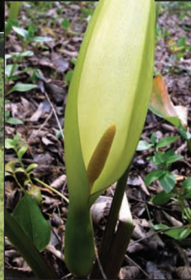
Sarriassa ( Arum italicum )