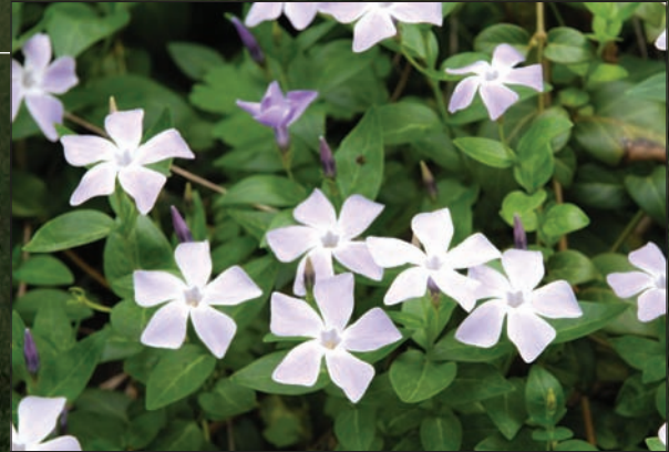
Vinca ( Vinca difformis )