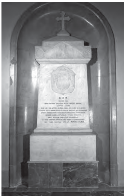
Sepulchre del bisbe Antoni-Lluís Jordà