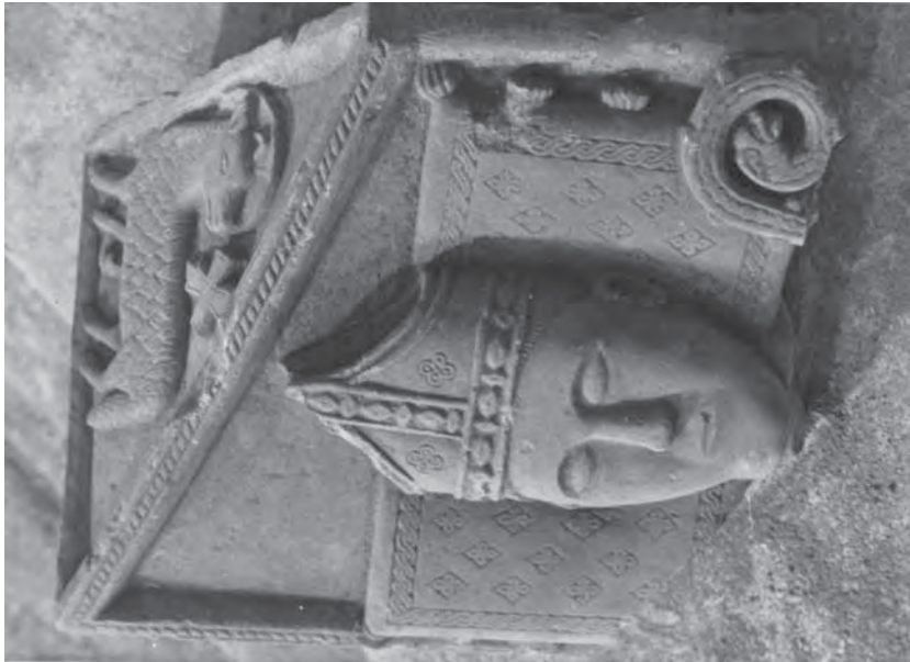
Sepulcre del bisbe Berenguer de Bellvís