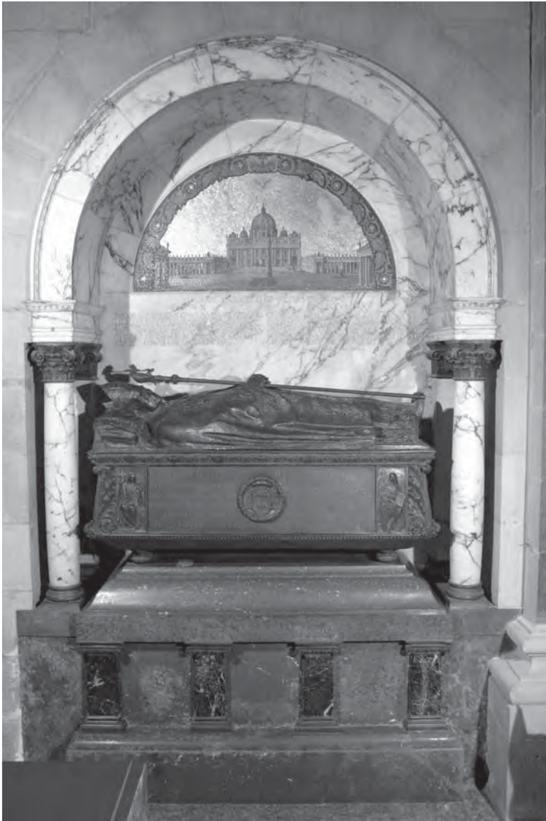
Sepulcre del bisbe Josep Torras i Bages