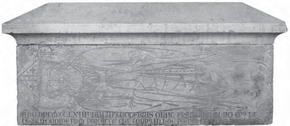
Sepulcre del bisbe Bernat de Mur