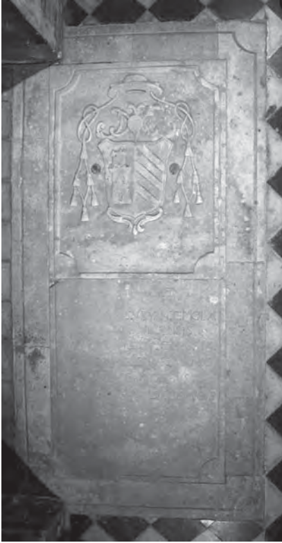
Sepulchre del bisbe Francec de Veyan