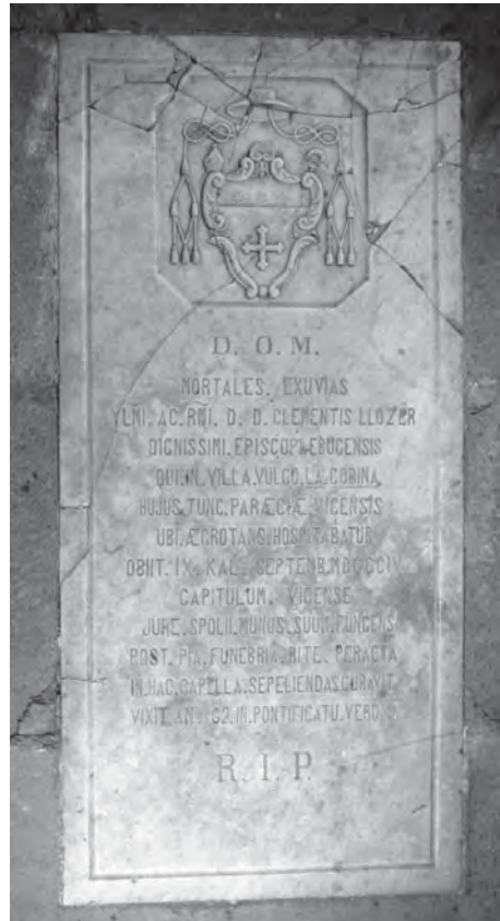
Sepulchre del bisbe d'Eivissa Climent Llozer, mort a Sentfores el 1804