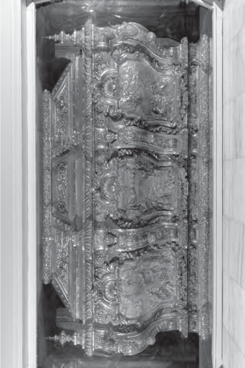
Sepulchre barroc (1728) de Sant Bernat Calbó