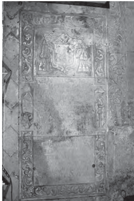
Sepulcre del bisbe Bartolomé Sarmentero