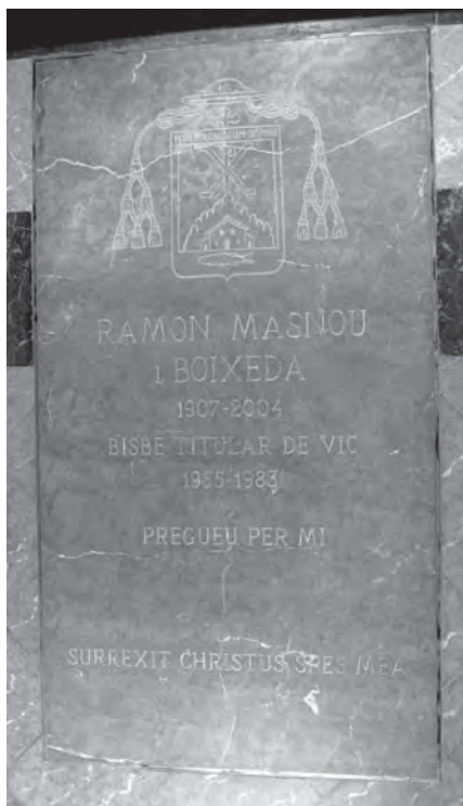
Sepulcre del bisbe Ramon Masnou