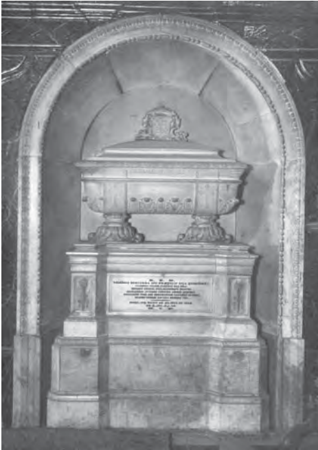
Sepulchre del bisbe Pablo de Jesús Corcuera