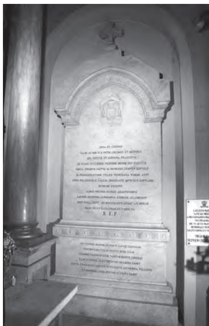
Sepulchre del bisbe Pere-Nolasc Colomer