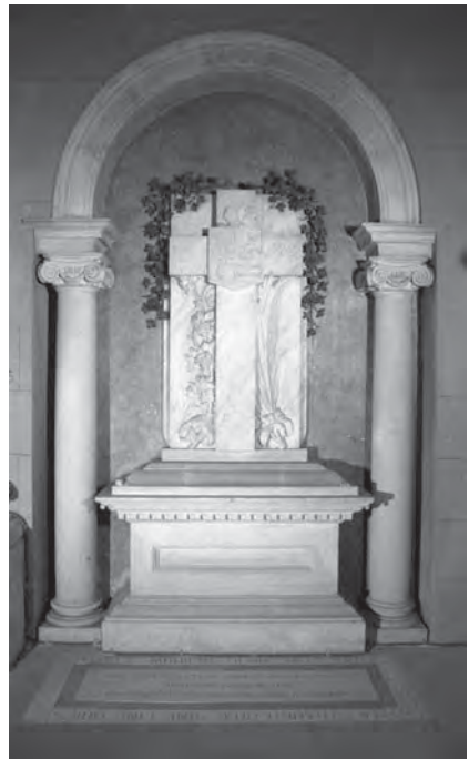
Sepulchre del bisbe Ramon Strauch