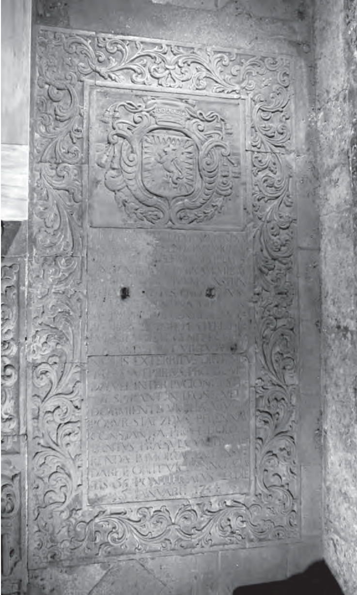
Sepulcre del bisbe Ramon de Marimon