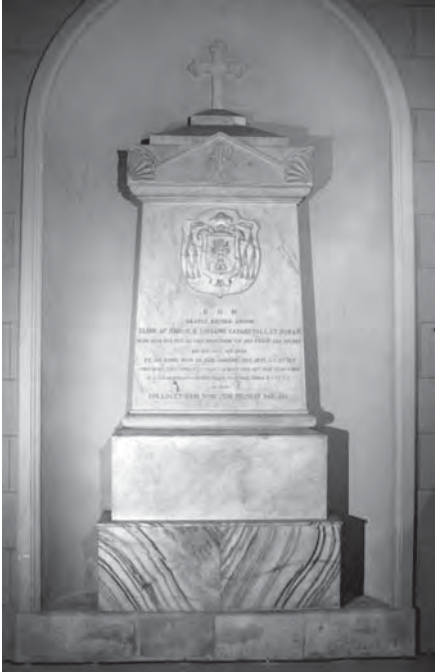
Sepulcre del bisbe Lluçia Casadevall