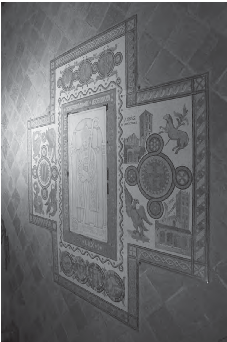
Sepulcre del bisbe Josep Morgades