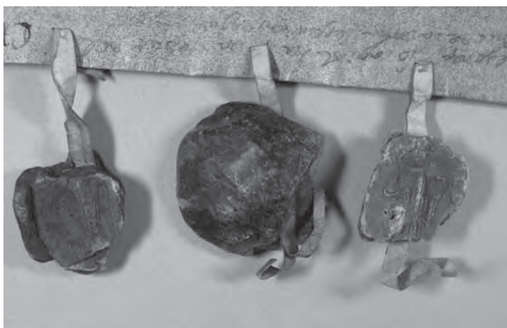
DETALL DELS SEGELLS