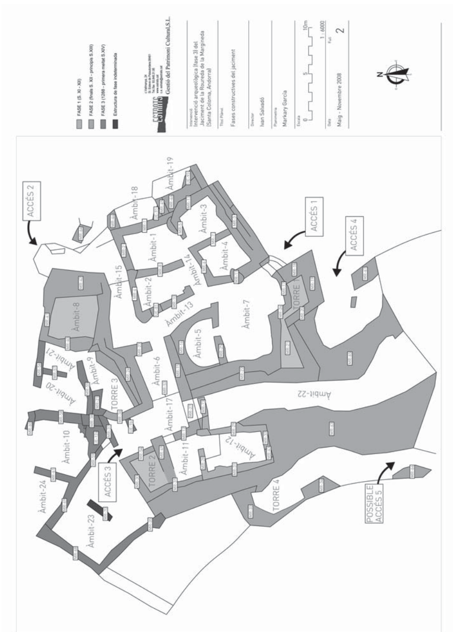
Fig. 1. Planta del jaciment de la Roureda de la Margineda amb indicació del lloc de la troballa de la pissarra amb text gravat (Markary Garcia - Estrats Gestió del Patrimoni Cultural, S.L.).