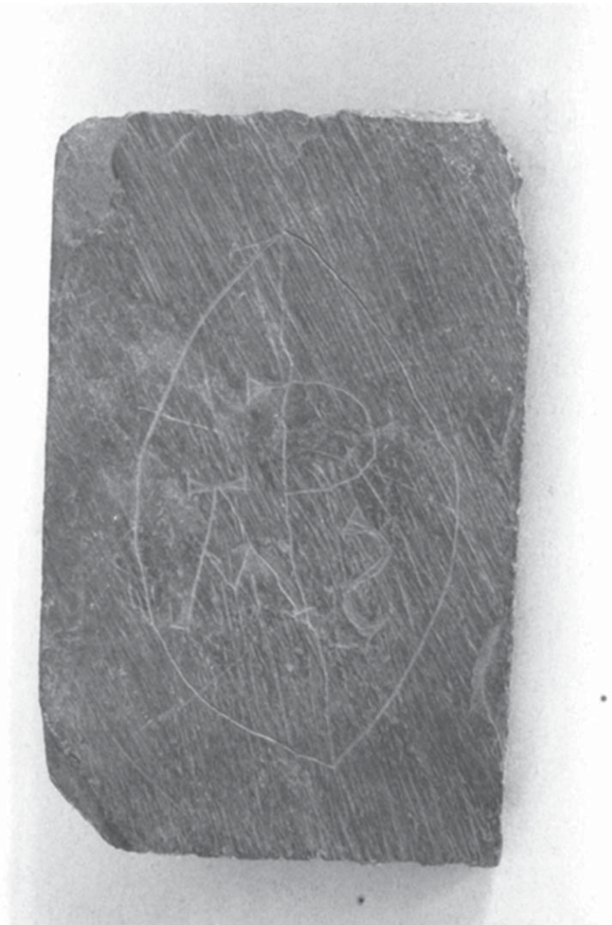
Fig. 4. Tapadora de reconditori de pissarra, procedent de l'Alt Urgell. MEV 9715 (Museu Episcopal de Vic).