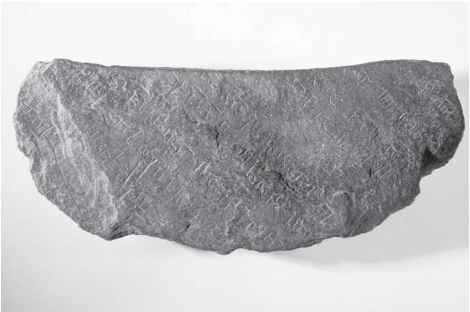
Fig. 2. Imatge de la peça.