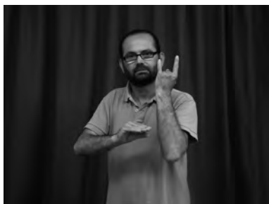
Figura 4. Cotxe prop d'un arbre

L'espai sígnic també es concreta en l'ús de les estructures de classificador. Els classificadors són morfemes complexos molt característics de la llengües de signes que expressen el moviment, la localització, les característiques físiques i geomètriques de l'entitat que denoten i també com la manipulem. Aquesta mena d'estructura, que no segueix les restriccions fonològiques pròpies de la resta de la llengua, utilitza l'espai sígnic de manera icònica per tal de representar diferents tipus de predicats, com ara els de localització i els de moviment. Per exemple, un cert tipus de classificadors permet mostrar la posició relativa de dos elements a través de l'espai relatiu que s'estableix entre la mà activa i la mà passiva 9 dins l'espai sígnic. En el cas dels predicats de moviment, també poden mostrar la forma de moviment dels elements que entren en joc i la distància relativa entre els uns i els altres. La figura 4 mostra un cotxe prop d'un arbre, mentre que a la figura 5 els dos elements apareixen allunyats. Amb aquests exemples veiem com la distància relativa entre els dos objectes dins l'espai sígnic és la que es vol expressar lingüísticament.