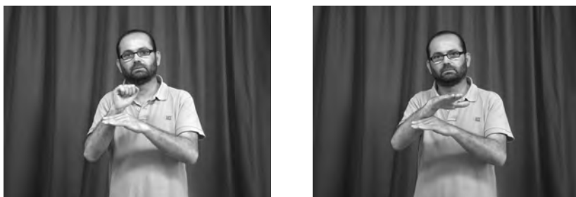
Figura 15. Forma no flexionada del verb ENVIAR

La segona diferència respecte la concordança amb el català és la possibilitat que té la LSC de marcar diferents tipus d’expressió de plural a l’objecte. A (15) ja hem vist com el moviment del verb es reduplicava —com indica la convenció genèrica de les glosses marcada amb «+++»— i això indica un objecte plural. En la majoria de les llengües de signes occidentals estudiades fins ara, els verbs de concordança presenten dos tipus de concordança amb el nombre, segons que expressin un plural distributiu o múltiple (PFAU & STEINBACH 2006). D’una banda, la forma distributiva té una reduplicació múltiple en un moviment en arc lateral fent unes petites pauses per tal de marcar diferents punts desplaçats a l’espai signic. De l’altra, la forma múltiple té un moviment en forma