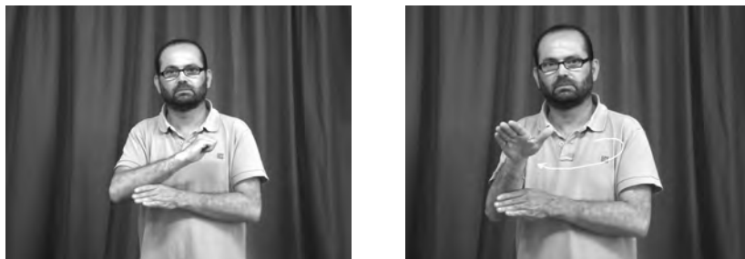
Figura 17. Plural múltiple del verb ENVIAR

Finalment, el plural dual també s'expressa amb l'articulació repetida del verb cap a les àrees de l'espai sígnic on s'ha associat els argu-