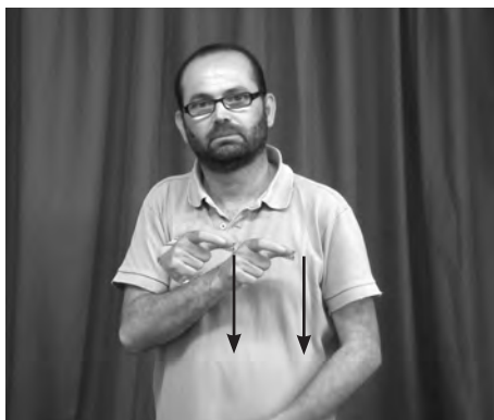
Figura 10. Reduplicació del signe PERSONA