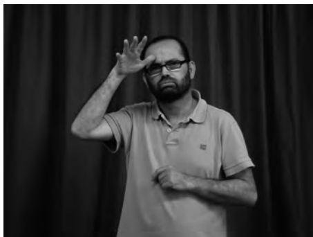
Figura 6. Signe CALOR

La configuració de la mà és la forma que adopten els dits de la mà per a realitzar un signe. L'orientació del palmell i dels dits consisteix en la direcció que adopta el palmell de la mà, d'una banda, i la direcció cap on apunten els dits, de l'altra. El moviment del signe consisteix en la forma, direcció i recorregut del moviment que es produeix a l'hora d'executar el signe. El lloc d'articulació del signe consisteix en la zona de l'espai i del cos del signant on es realitza el signe. Finalment, el component no manual consisteix en els elements articulats a través de l'expressió facial, el moviment del cap i/o el tronc, així com també els moviments fets a través dels llavis i que tant poden derivar-se de la paraula de la llengua oral com ser moviments propis que acompanyen el signe, que no tenen res a veure amb el català parlat. Vegem-ne un exemple. A la Figura 6, podem observar els components formatius que formen el signe CALOR. La configuració de la mà consisteix en els dits estirats i la mà oberta; l'orientació del palmell s'orienta cap enfora i cap al terra; el moviment es produeix des de la part passiva del front a la part activa; 10 el lloc d'articulació és el front, en què hi ha un punt de contacte amb el polze, i el component no manual consisteix en un arrufament de celles i en un component bucal «bufar».