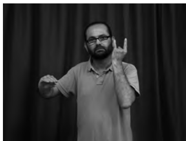
Figura 5. Cotxe lluny d'un arbre