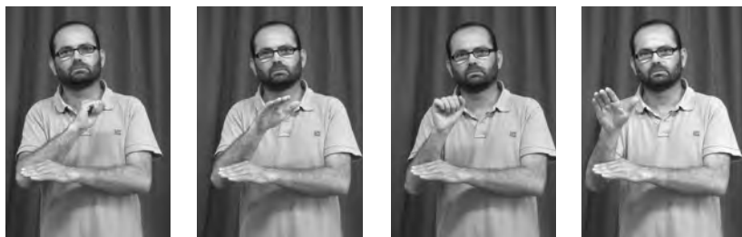
Figura 16. Plural distributiu del verb ENVIAR

d'arc continuat, sense reduplicacions. I finalment, la forma dual té una reduplicació que s'articula només dues vegades. A més, els signes mono-manuals poden realitzar-se bimanualment per a expressar pluralitat d'arguments objecte.