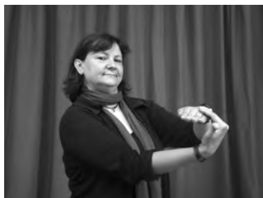
b. 3-CONVIDAR-1 'Ell/a em convida'