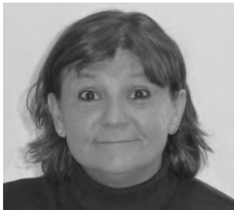
Figura 12. Marca no manual de tema

Els elements que actuen com a tema es marquen a través dels components no manuals següents: celles aixecades, ulls oberts, un avançament del tors i del cap i una pausa al final del signe (figura 12). En LSC podem trobar diversos tòpics introduïts en una mateixa oració. Els elements temporals i locatius acostumen a formar aquest marc temàtic.