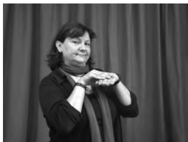
a. 1-CONVIDAR-3 'Jo el/la convido'