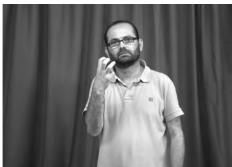
Figura 11. Incorporació del nombre al signe FALTAR

mans amb els corresponents dits, la cara, el cap i el tors— permeten que puguem utilitzar-los per a expressar el plural. La incorporació del nombre consisteix a utilitzar tants dits de la mà com elements vulguem denotar. Com podem observar a la figura 11, el signe manual FALTAR incorpora tres dits per a expressar el plural i denotar ‘en falten tres’.