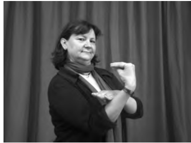
b. 3-ENSENYAR-1 'Ell/a m'ensenya'