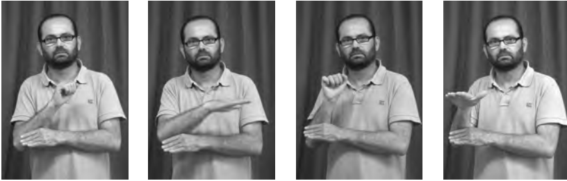
Figura 18. Plural dual del verb ENVIAR

ments objecte del verb (Figura 18). La diferència principal entre el plural distributiu i el plural dual és que el primer es pot repetir fins a tres vegades i dibuixa una forma d'arc a l'espai sígnic. El plural dual només té dos moviments i es realitza amb una direcció més contrastada cap a les dues àrees oposades de l'espai sígnic, el costat passiu i l'actiu.