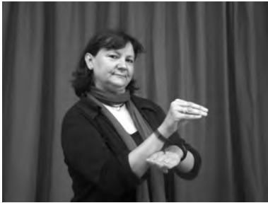
a. 1-ENSENYAR-3 'Jo li ensenyo'