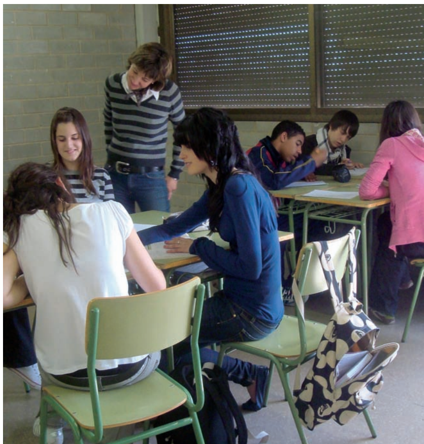
Quadre 4. Activitat «Grafitis a prova de bomba». Pauta per resoldre el problema.

Per finalitzar l'activitat, cada alumne va escriure un text per a l'autor de l'article. Disposaven d'una pauta per preparar-ne l'argumentació (quadre 5).