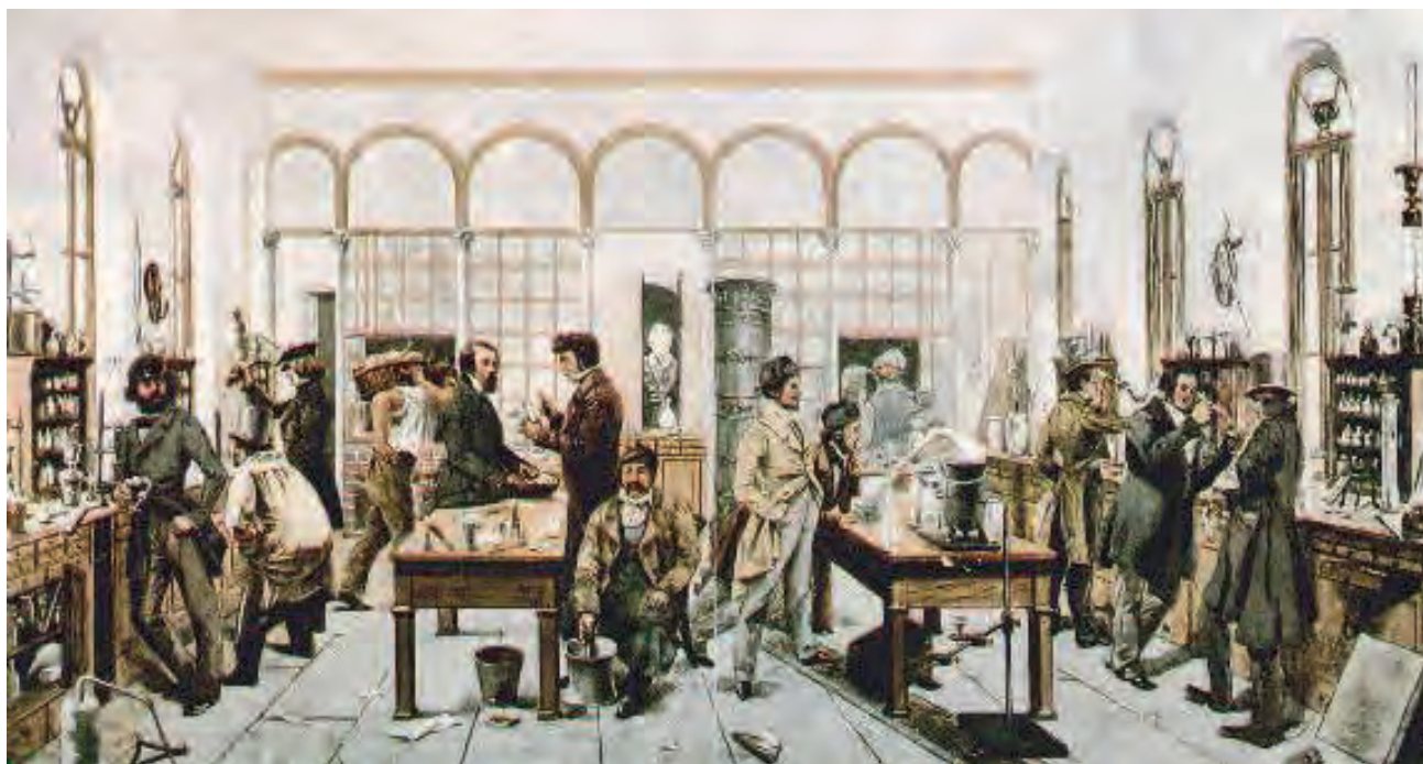
Laboratorio de Química de J. von Liebig en Gissen, Alemania, durante la primera mitad del siglo XIX.

Las prácticas químicas son realistas y asumen la existencia de diversas entidades. Específicamente