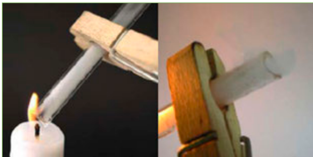
Figura 2. El tub s'omple de fum blanc.