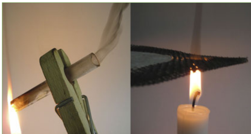
Figura 9. Amb el tub a la part alta de la flama o tocant-la amb un objecte fred apareix fum negre.

Arribem a la conclusió que en totes dues combustions no es produeix cap gas combustible (no