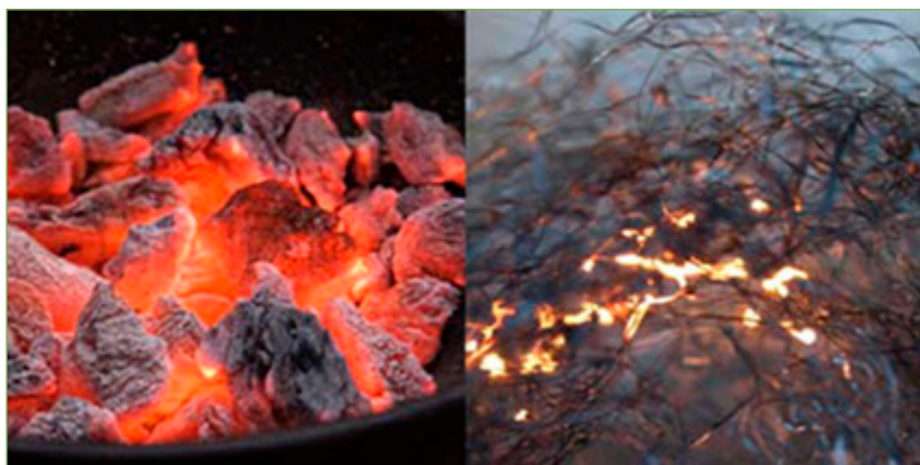
Figura 11. El carbó i la llana de ferro, incandescents, cremen sense flama.

El que s'ha après en aquesta seqüència connecta bé amb