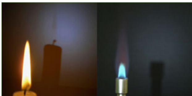
Figura 12. Una flama lluminosa fa ombra però, curiosament, una flama menys brillant no en fa.