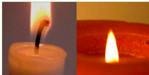
Figura 6. Diferències entre la «copa» d'una espelma normal i la d'una altra de molt més gruixuda.

a la part superior de l'espelma. Aparentment no té res de particular, conté parafina fosa per la proximitat de la flama. Podem aportar imatges (fig. 6) on es pugui comparar una espelma ordinària amb una altra de molt més gruixuda, on la copa faci uns 5 cm de diàmetre.