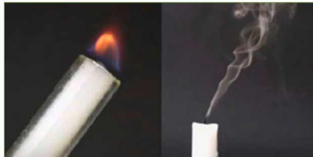
Figura 3. El fum blanc és combustible. També apareix en apagar l'espelma.