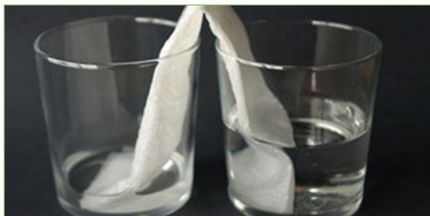
Figura 5. L'aigua passa espontàniament del vas de la dreta al de l'esquerra.