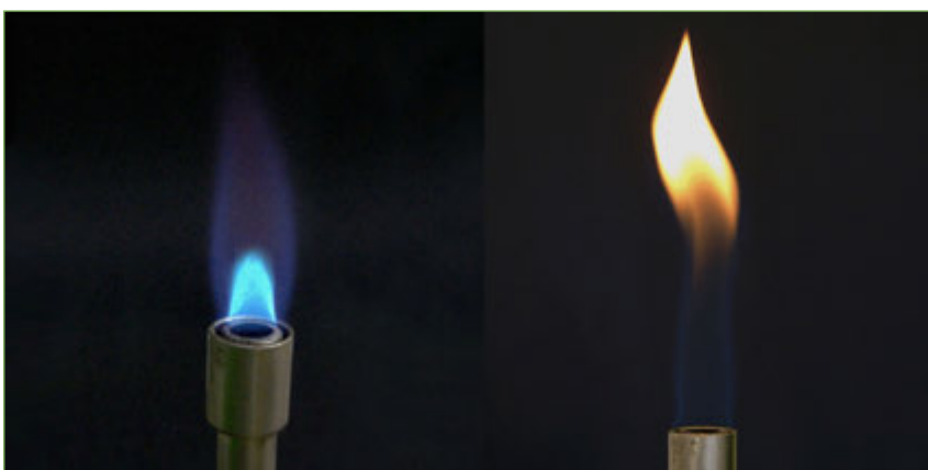
Figura 14. Un bec Bunsen amb flama oxidant (esquerra) i un altre amb flama reductora.

l'experiment, fet a segon curs, de cremar un fruit sec i escalfar aigua amb la calor produïda per mesurar el seu important contingut energètic. La combustió dels aliments es desenvolupa en el cos humà a una temperatura molt menor i sense flama, però alliberant la mateixa energia. Però no de cop, sinó per processos molt més graduals que resulten més eficients. Hi ha robustesa (33).