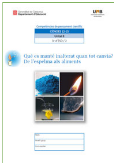
Figura 1. Portada de la unitat 8, «Què es manté inalterat quan tot canvia? De l'espelma als aliments» ( https://formacio.cesire.cat/ciencias1215/ ).

Per a dirigir la conversa sobre un sistema, el professor utilitza