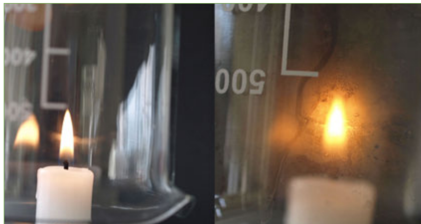
Figura 8. Al cap de poc el vas s'entela.