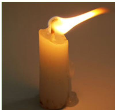
Figura 7. Una flama inclinada pot fondre la paret de la copa i provocar el vessament del líquid.

Centrem l'atenció sobre el fet que la condensació es produeix a la cara interna del vas, no a l'exterior. D'on pot haver sortit el vapor d'aigua? Sembla clar que només pot haver sortit de la flama i que, en acumular-se vapor d'aigua al costat d'un vidre