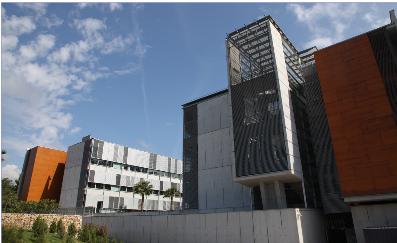
Figura. 1. Fotografia de l'Institut Català d'Investigació Química.

ritme i el volum de feina que tenen. Nosaltres, com a professionals amb experiència, tenim les eines per brindar a les noves generacions una visió més oberta del que comporta fer un treball d'investigació. Els alumnes veuran que es necessita molta feina i disciplina, sí, però també que l'experiència de descobrir i d'aprendre els proporciona unes habilitats i competències que no s'imaginaven.