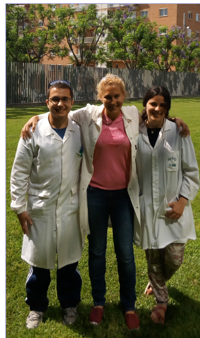
Figura 7. Fotografia d'equip després de diverses sessions sense obtenir els resultats esperats.

Finalment, els alumnes no només s'emporten una assignatura superada i una motivació personal, molts d'ells ja comencen a interessar-se per altres activitats i es presenten a concursos, tallers, beques...; en general, busquen llocs on poder satisfer les seves inquietuds i on poder demostrar les seves habilitats o aprendre'n de noves. Qualsevol persona amb certa experiència en el seu àmbit sap de primera mà que avui en dia una de les coses més importants és crear teixit i comunitat. Participar en diversos espais t'obre la porta a un món de possibilitats en l'àmbit professional i fins i tot a nivell personal. Actuant així els joves poden arribar a trobar nous