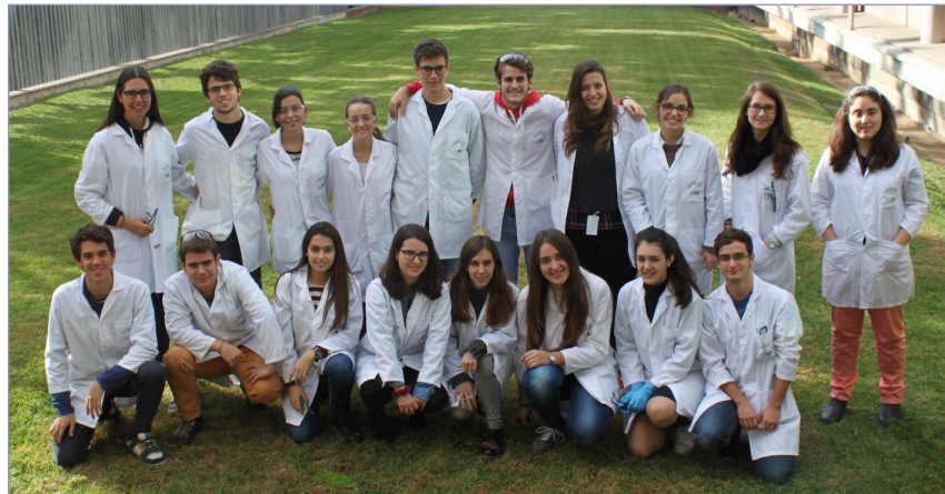
Figura 4. Alumnes del programa «Bojos per la Ciència - Química» 2017.

A l'ICIQ tenim clar que la recerca en química és clau per donar solució als problemes que la nostra societat ha d'afrontar.