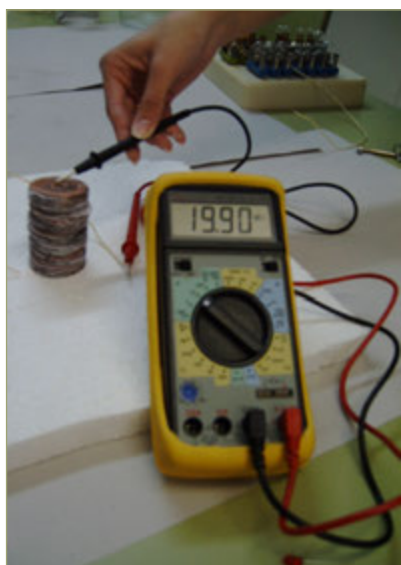
Figura 3. Replicació de la pila de Volta.

— Haver pogut conèixer aspectes de la història de l'electricitat i de les ciències de la vida, descobriments històrics i les lleis que regien aquests fenòmens descoberts.