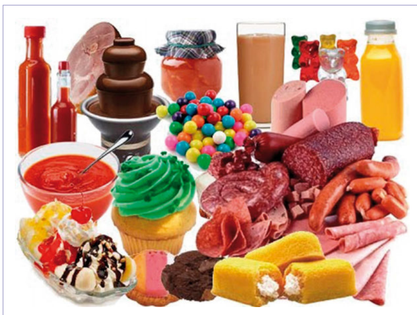
Figura 1. Aliments que poden contenir additius.

rament, o bé establir-ne l'aspecte i les característiques físiques. Per això molts aliments en porten (fig. 1).