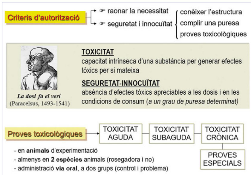
Figura 2. Esquema de l'avaluació experimental de la seguretat dels additius alimentaris (1).