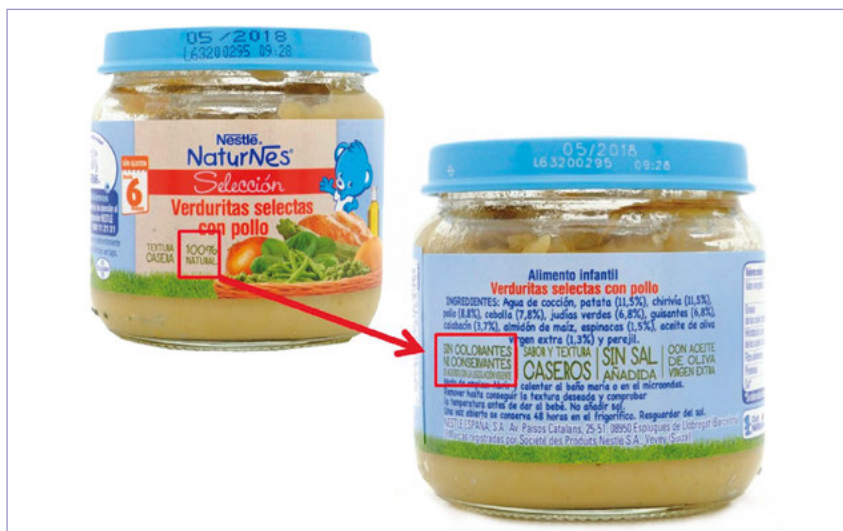
Figura 4. Etiquetatge d'un aliment amb referències a additius alimentaris.