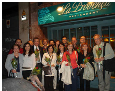
Figura 2. Junta de la Societat Catalana de Química durant el període 2002-2008.

Confiam que el contingut d'aquest monogràfic ajudi a