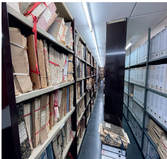
Imagen 1 Archivo de la Facultad de Formación del Profesorado. Fuente de elaboración propia.

La labor de acceso y búsqueda de documentación relativa a los Cursillos en el mencionado archivo se realizó durante siete meses. Este proceso permitió localizar un conjunto de documentos que pasaron a ser criticados externa e internamente para dictaminar su validez y veracidad.