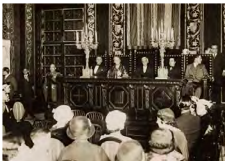
Acte de clausura del XVIII Curs Internacional Montessori el 1933 al saló de sessions del Palau de la Generalitat amb el president Francesc Macià i la doctora Maria Montessori.