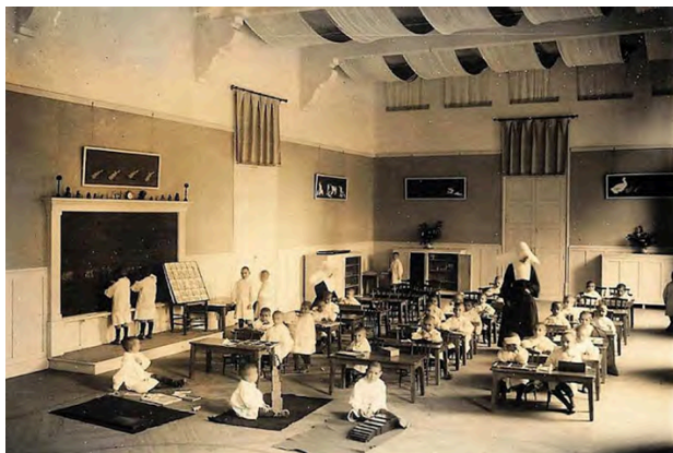
Casa de Maternitat de Barcelona. Assaig del sistema Montessori. 1914.