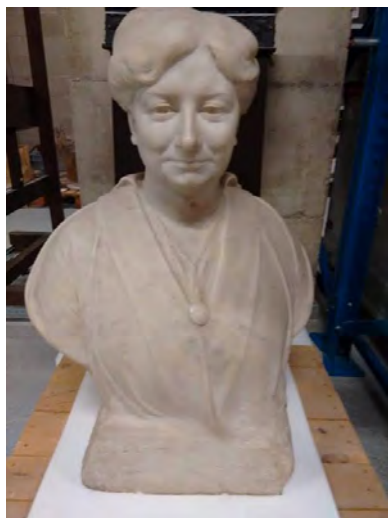
Bust de la doctora Montessori encarregat pels alumnes del Curs Internacional Montessori de 1916 per oferir-li de regal al final de curs.