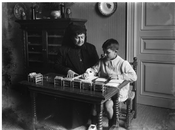
Maria Montessori amb un alumne a la Casa dels Nens de Barcelona (any 1916).

El format dels cursos que solia fer la doctora Montessori, constituïts, com el de Barcelona, per trenta-vuit lliçons, a part de les observacions i pràctiques, queda molt lluny dels que es fan actualment, amb més de quatre-centes cinquanta hores de lliçons, a part de les observacions i pràctiques, en un curs de l'Associació Montessori Internacional (AMI) d'educació primària. La mateixa Maria Montessori ho reconeixia més tard en una entrevista feta a Barcelona el 1919, en la qual comentava que voldria establir centres permanents d'entrenament arreu on anava, perquè aquells cursos curts que s'estaven duent a terme no eren suficients per preparar mestres. 18 Deia que ella només tenia temps per exposar les seves idees i que, per això, els mestres tenien mancances en coneixements i altres aptituds, que havien de suplir amb una formació posterior amb gent experimentada. Una bona formació hauria d'incloure, per exemple, les instruccions en totes les àrees, com ara les ciències naturals, la higiene o l'art.