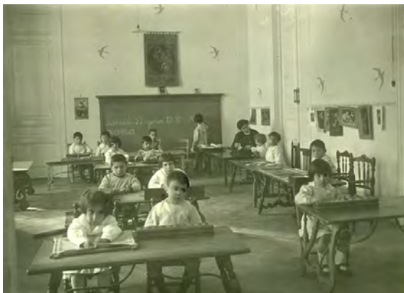
Escola Montessori. Aula de la Casa dels Nens (22 de gener de 1916).

que a final d'any arribaria Maria Montessori a Barcelona a fer-hi el Curs Internacional, i calia tenir l'escola en condicions per servir d'escola model. Altres reptes per al nou curs 1915-1916 eren: trobar un lloc més gran per a l'escola per poder tenir-hi més aules per a més alumnes i grups, una sala de música i un pati al voltant. Finalment, van trobar el local al carrer Diputació, número 61, i així van poder admetre fins a cent divuit infants.