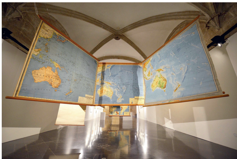
Imatge 5: Instal·lació dels mapes d'Oceania com a espai de possibilitat

Després de l'experiència amb aquestes instal·lacions volem acabar amb les preguntes següents: seguirem continuarem veient els mapes i el material cartogràfic del fons de l'arxiu del Museu Pedagògic de Castelló com un material didàctic utilitzat en un moment determinat de la història de l'educació? O més aviat com un material que encara pot generar noves possibilitats d'aprenentatge?