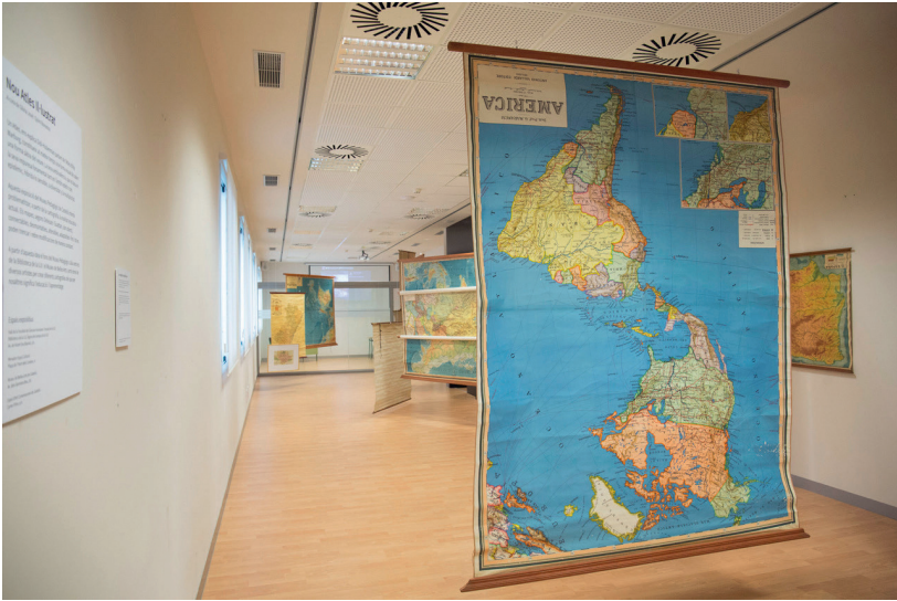
Imatge 2: Mapa d'Amèrica surejat

Com que la instal·lació no es pot aprehendre d'un sol cop d'ull cal que l'audiència es passegi per la sala a fi de veure'n els detalls. En aquest moviment per la sala l'usuari de la instal·lació va veient les diverses superposicions que fan els mapes entre ells, creant diverses narracions que es fan i es desfan a mesura que s'hi desplacen. La intervenció pretén reflexionar sobre el que representa un mapa i la forma en què es mostren inviten a crear noves cartografies i establir nous diàlegs que ens ajuden a construir narratives que sovint han quedat invisibilitzades, atès que es convidava l'audiència a recórrer la instal·lació i fotografiar-la creant nous conjunts territorials a partir de les diverses superposicions de mapes que es podia trobar en ellatrobant-hi i compartir les fotos a Twitter i a Instagram amb el hashtag #apuntsregles.