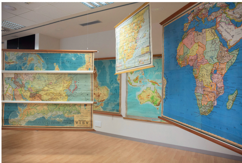
Imatge 3: Laberint de mapes a l'espai Menador

La intervenció «Les regles cartogràfiques» conjuga els dos principis sobre els que quals s'assenta el pensament cartogràfic post-representacional. 29 Per una banda exerceix una part de la feina deconstructiva que intenta desemascarar aquelles veritats ocultes entre les línies del text cartogràfic; així, l'audiència, segons el punt de vista que esculli, pot veure-hi relacions de dominació econòmica, cultural o política d'uns països sobre altres, entre d'altres. 30 D'altra banda, veu els mapes com pràctiques, experiències, actuacions i espais. 31 La instal·lació, com ja hem dit, no es pot aprehendre des d'un punt fix només amb la mirada, per la qual cosa, el públic necessita recórrer-la, experimentar-la i sentir-la amb tots el cos, ja que la naturalesa fragmentària de les instal·lacions necessita que els cossos de l'audiència siguin tractats com a presències en l'es-