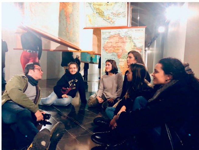
Imatge 4: Instal·lació en el marc de l'exposició «Apunts sobre la impossibilitat de la imatge del món»

A l'exposició realitzada a Lleida, hem invitat a tres artistes contemporanis, Walmor Correa, Roc Domingo i Maite Vilafranca, perquè ens ajudin amb la seva mirada a explorar el que pot esdevenir del diàleg i la interacció amb el material que forma part del patrimoni històric, en aquest cas un material concret, els mapes. Les seves creacions han traçat noves cartografies i noves propostes que han permès que escoles que han partit d'aquesta exposició desenvolupessin els seus projectes de treball. 54