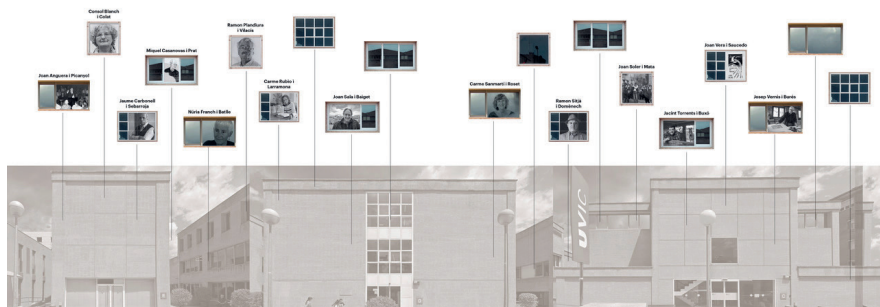
Figura 4: Mural de les professores i els professors entrevistats, elaboració pròpia.

de fer públic un moment evocatiu, amb narracions que invitin més que no pontifiquin, hem creat la instal·lació de les finestres pedagògiques, recollides en el llibret d'homenatge i que plasmem a les parets d'una de les aules de la FETCH.