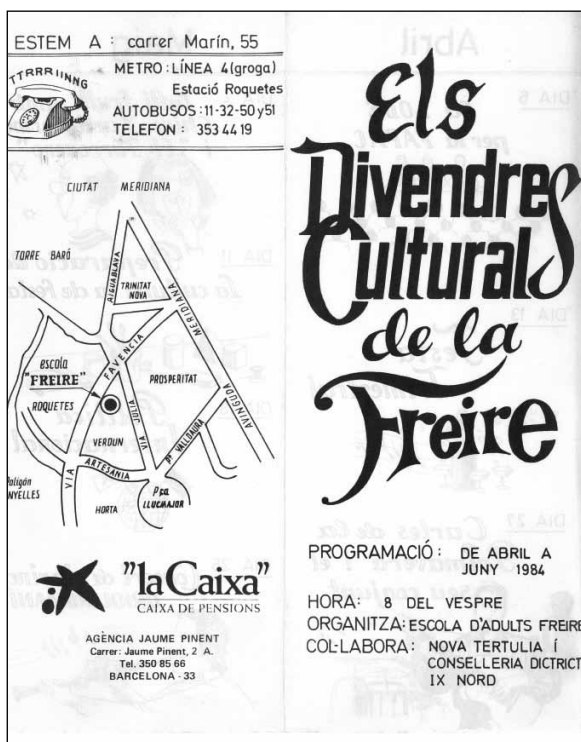
Imatge 3. Divendres de la Freire.