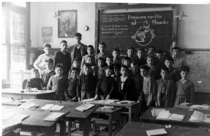
Fotografía 1. Grupo de estudiantes del Grupo escolar S. Francisco, en la localidad de Bermeo (Guipúzcoa). 44

contribuyó. Se puede apreciar en el caso de sus capacidades para las labores de la pesca o la navegación en el contexto de la llegada a América bajo el reinado de los Reyes Católicos (ver Fotografía 1). 42 Esta idea que busca formar parte del carácter primigenio de la esencia de la nación española podría estar ligada, como apunta el profesor José Álvarez Junco, a la exaltación de la identidad vasca propia del siglo XVII. 43 De este modo, se produce una vinculación a la identidad española desde las aportaciones propias.